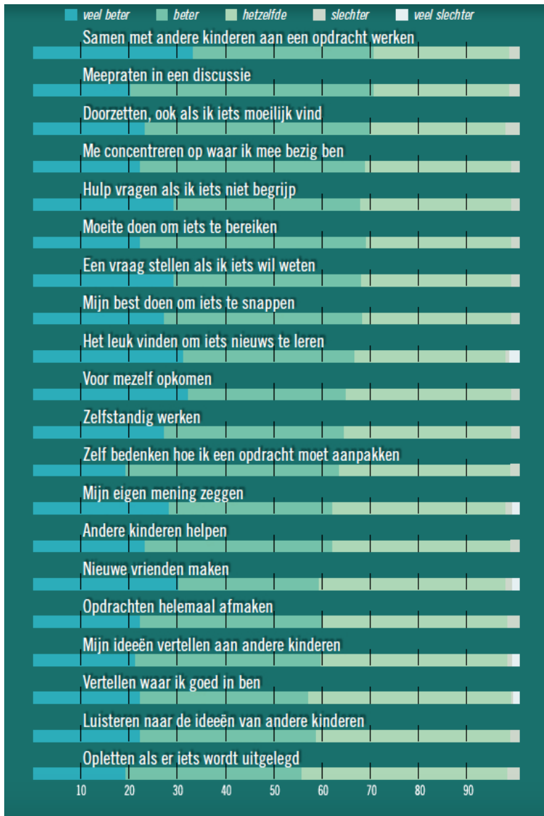
Schema 2: resultaten zelfevaluatie leerlingen na deelname Playing for Success. Oberon, 2016.