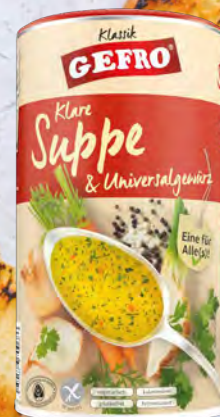
GEFRO Klare Suppe & Universalgewürz → Seite 13