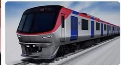
2020年から新デザインが登場