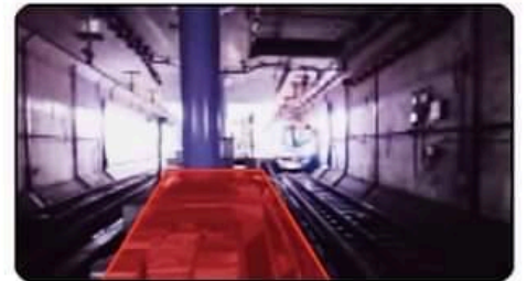
秋葉原駅の延伸部分