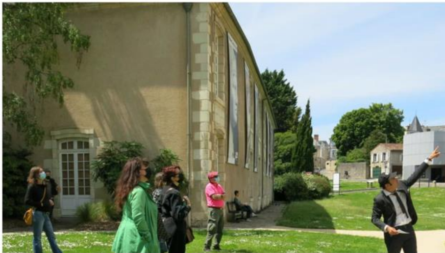
Que ce soit dans la cour du musée Sainte-Croix, sur le parvis de l'espace Mendès-France, derrière la cathédrale, la visite est émaillée d'anecdotes pas toujours très « catholiques ».