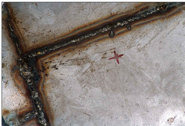
01 ↗ Antes de la aplicación

Desoxidante en pasta para acero inoxidable