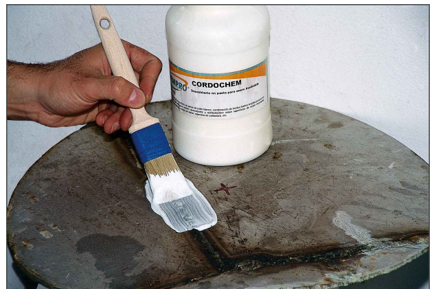
02 ↗ Durante la aplicación