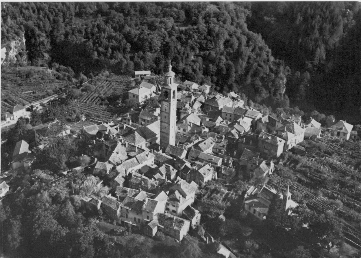
Intragna in einem Flugbild vor etwa 20 Jahren.

Der Sitz des Museums ist Intragna, Hauptort des Centovalli, das alte Patrizierhaus der Maggetti hinter der Kirche; es konnte gekauft und renoviert werden dank finanzieller Hilfe der PRO HELVETIA, des SCHWEIZER HEIMATSCHUTZES sowie weiterer Gönner. Die Kosten beliefen sich auf über Fr. 30000.-.