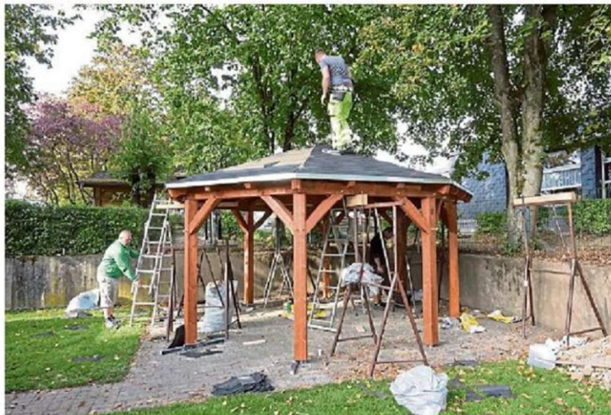
Letzter Schliff: Das Oktogon an der Kirche soll neuer Treffpunkt für Jugendliche in Bechen werden.

Kürten). Der Verein engagiert sich seit 20 Jahren in der offenen Kinder- und Jugendarbeit, ist Träger mehrerer Treffs in der Gemeinde und will auch am Pavillon, dem offenen Treff am sogenannten Oktogon, eine dezente pädagogische Begleitung übernehmen.