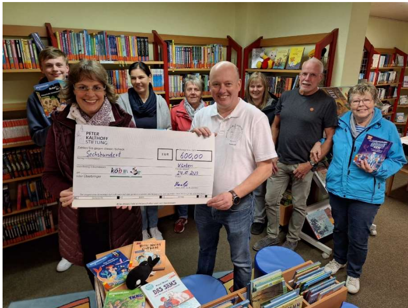
Scheckübergabe am 24.10.2023