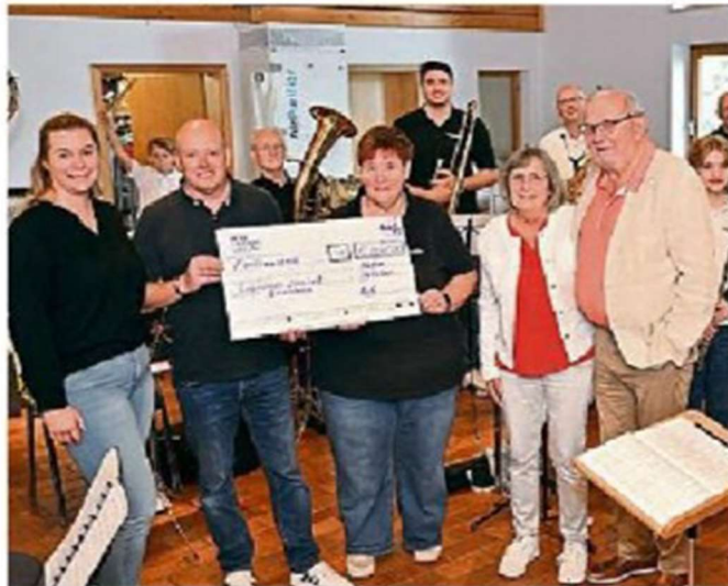
Scheckübergabe: Dank der Für 5000 Euro der Peter-Kalthoff-Stiftung können neue Instrumente gekauft werden.