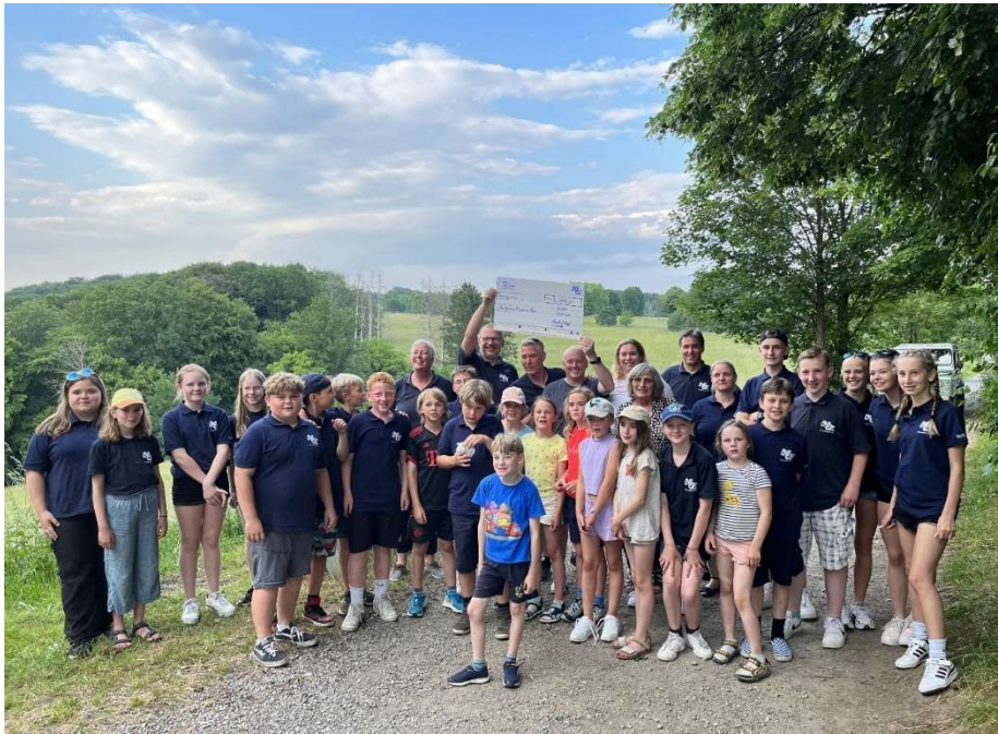
Scheckübergabe am 09.06.2023