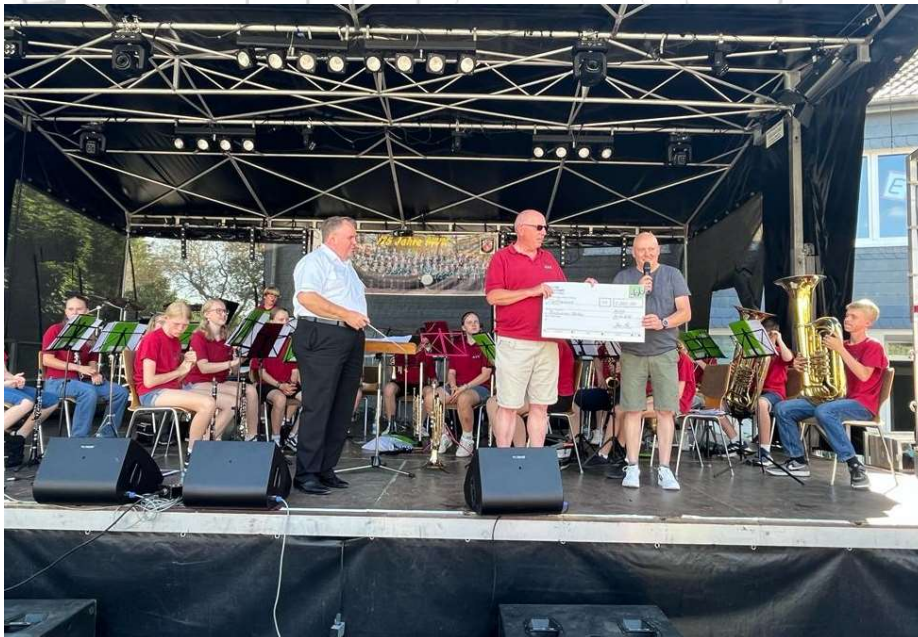
Scheckübergabe am 18.06.2023