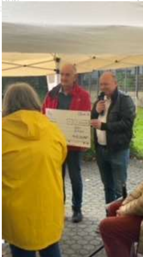
Scheckübergabe am 24.10.2023