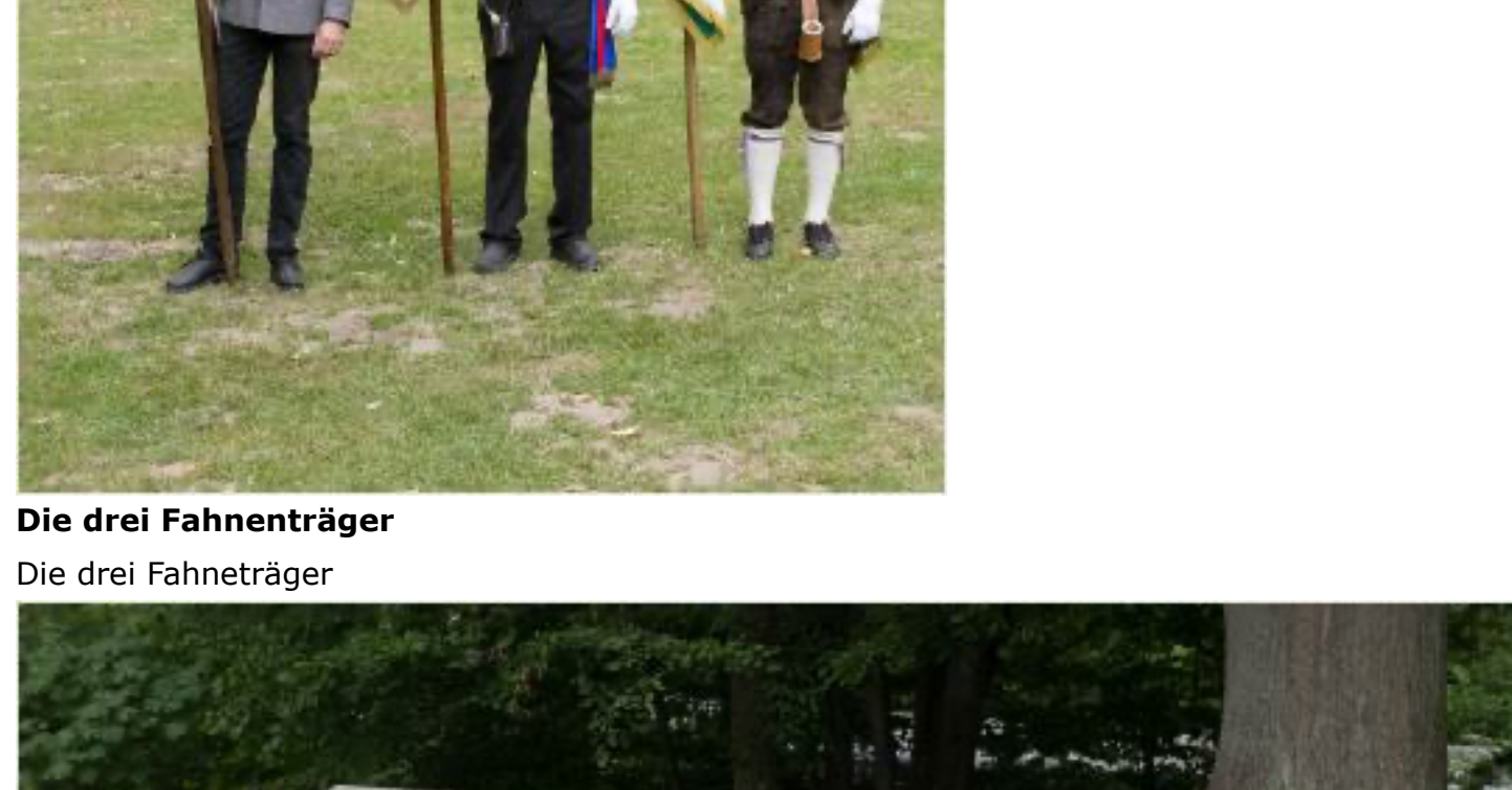
Die Schützenkompanie Kastelbell von 1959