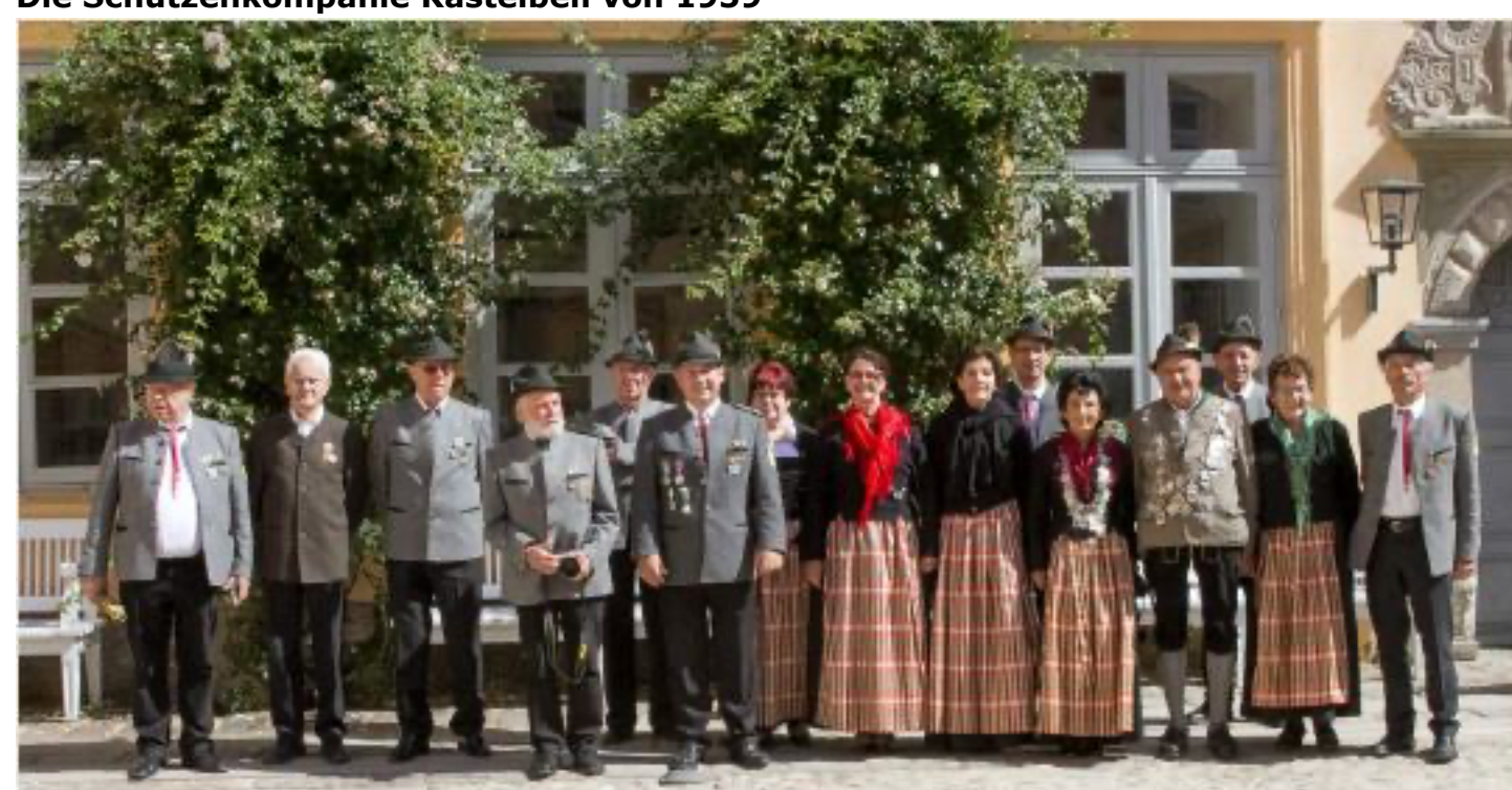
Antreten im Schloss