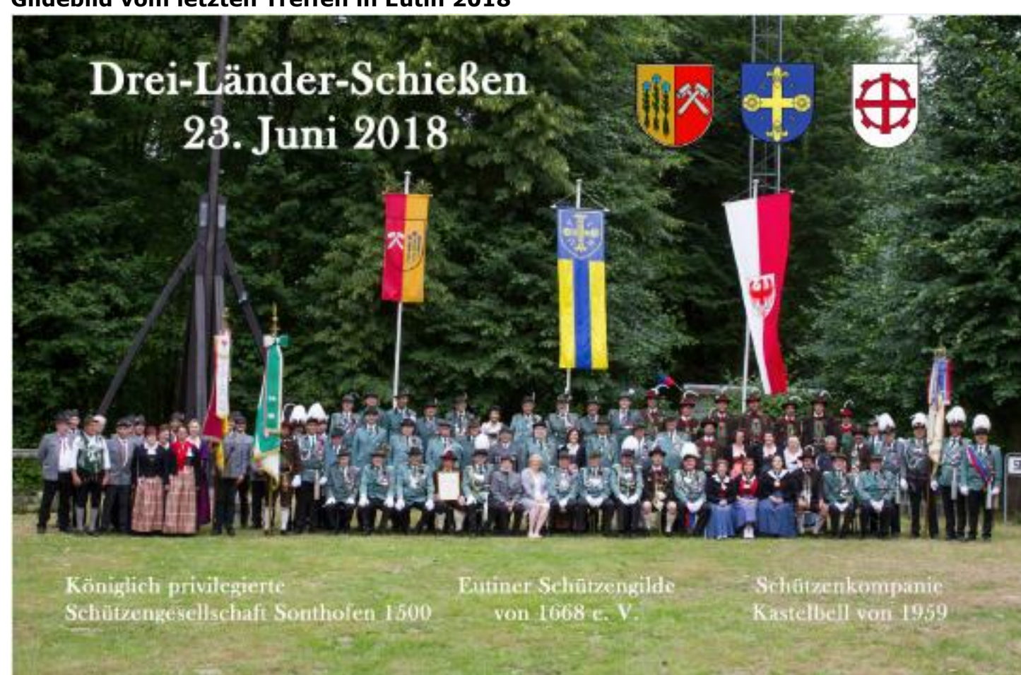
Gruppenbild der befreundeten Vereine