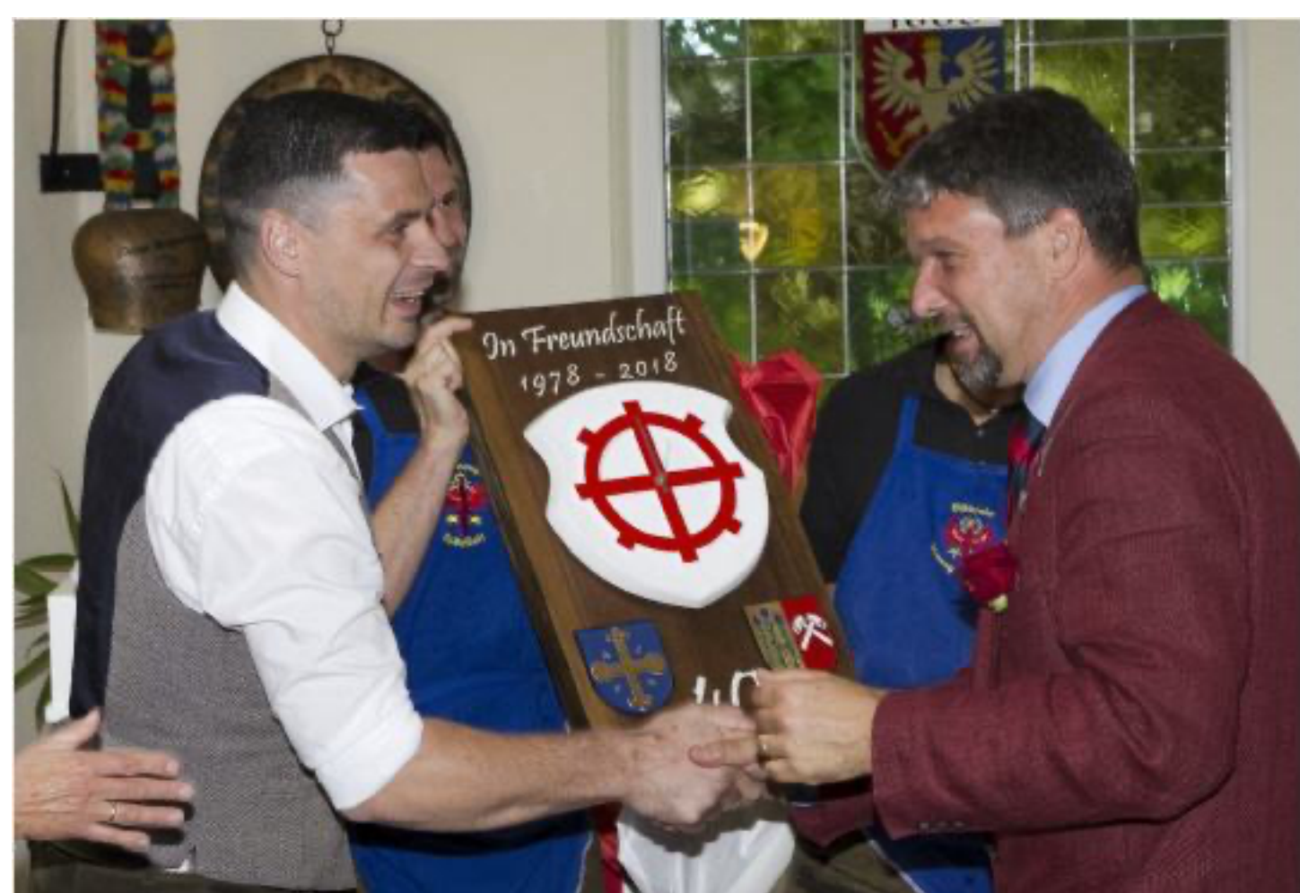
Übergabe des Gastgeschenkes aus Kastelbell.