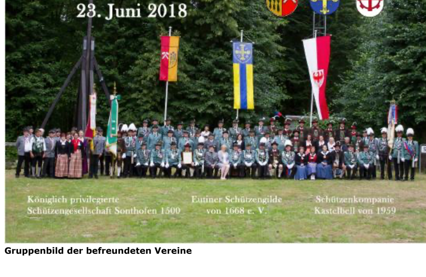
Gruppenbild der befreundeten Vereine