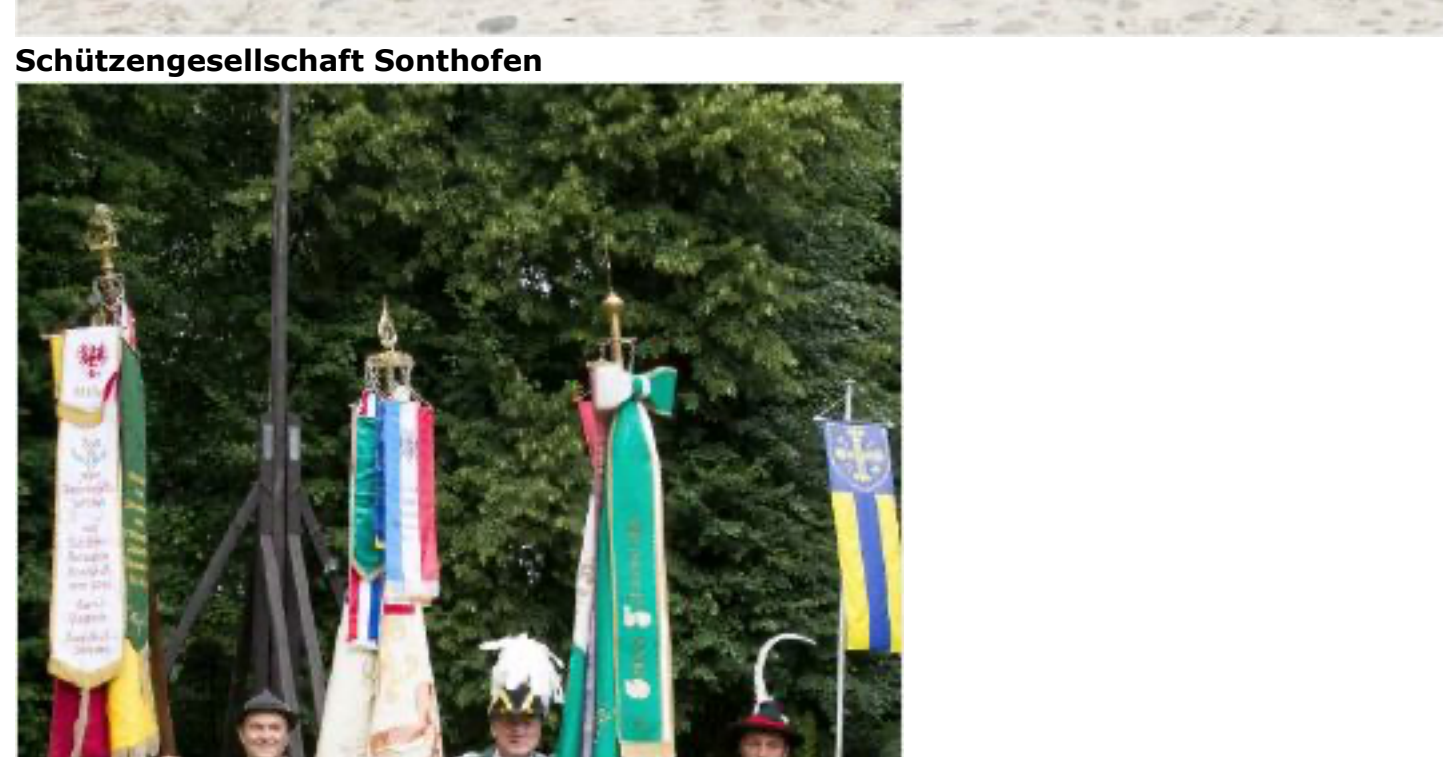
Der Drei-Länder-Vogel 2018