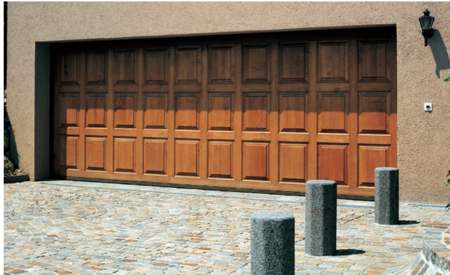
Kipptor mit Eichenkassettenfüllung

«Unsere Kunden haben den gleichen Ansprechpartner für Beratung, Planung, Fertigung, Montage sowie Service. ... natürlich alles Made by Steiner AG!»