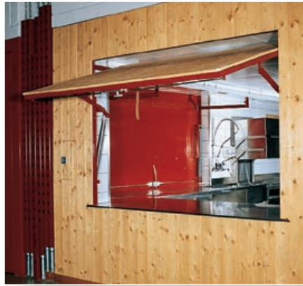
Office-Kipflügel für Mehrzweckhallen