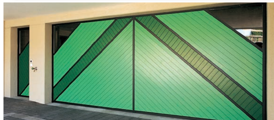
Kipptor mit spezieller Füllung