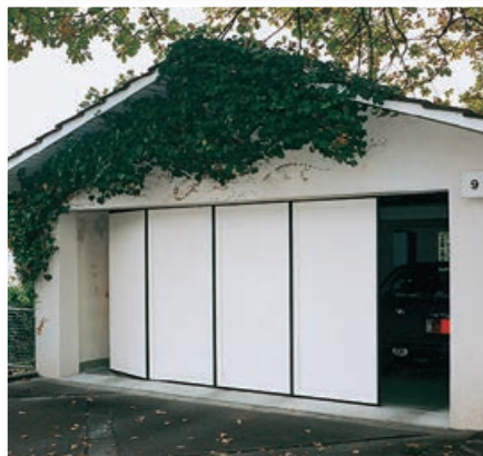
Seitensektionaltor an Privatgarage