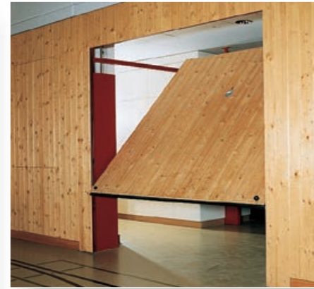
Geräteraumtore nach SUVA-Vorschriften