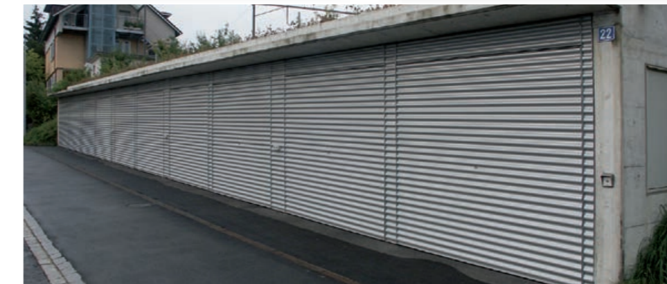
Kipptorfront mit Federzugsystem