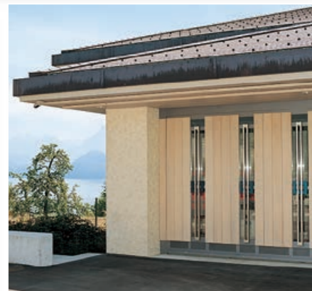
Kipptor an Privatgarage mit Seilzugsystem