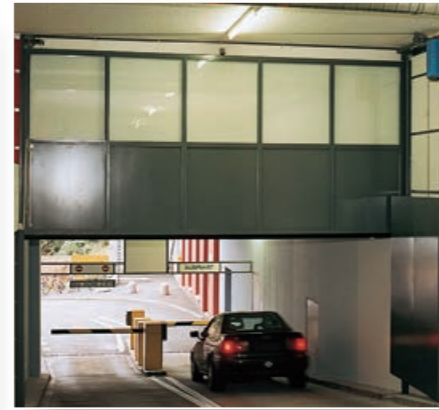
Hubtor bei Parkinghaus-Ausfahrt