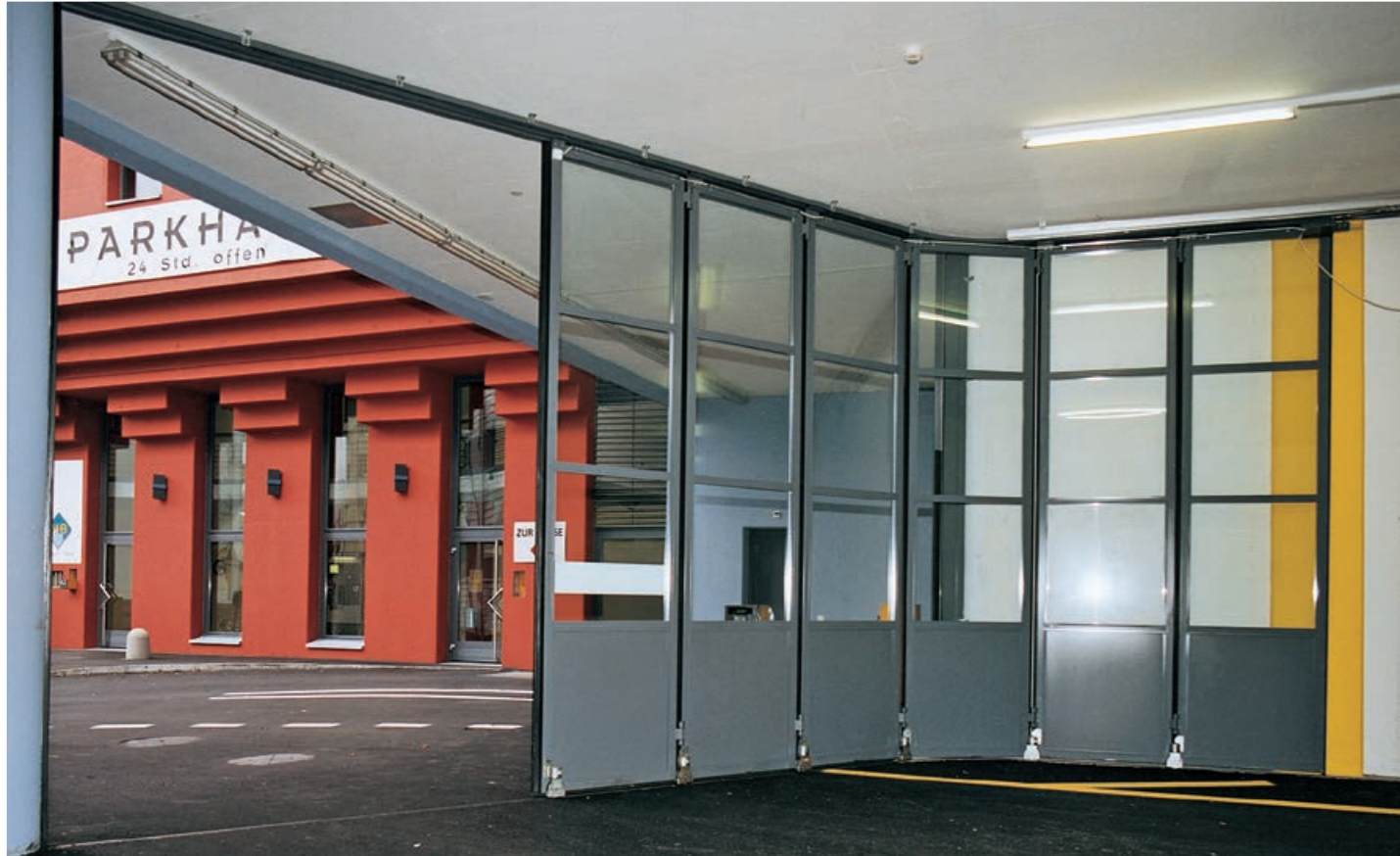
Seitensektionaltor in Parkinghaus