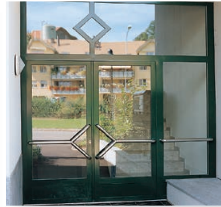
Eingangspartie mit Flügeltüre