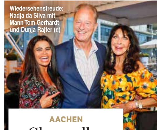
Wiedersehensfreude: Nadja da Silva mit Mann Tom Gerhardt und Dunja Rajter (r.)