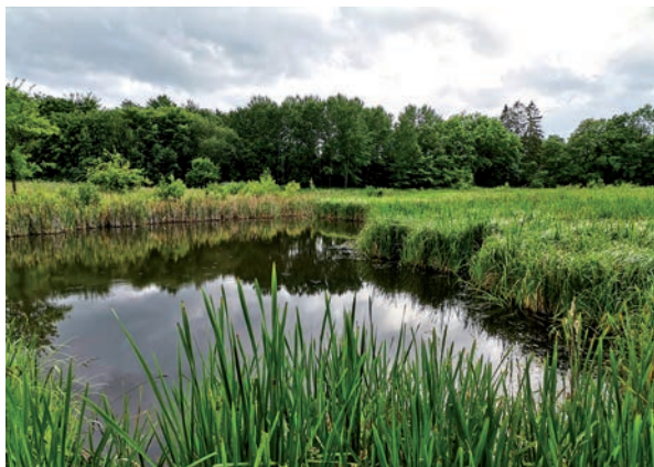
Wasserrückhalt in der Landschaft: in Zeiten des Klimawandels ein Muss.

Auf unserer Wanderung rund um den Erlebnisraum und das Kirchenland an Bolands-Au und Lachsbach besichtigen wir verschiedene Gewässerschutz- und Renaturierungsmaßnahmen, die von der Kirchengemeinde umgesetzt wurden. An praktischen Beispielen beschäftigen wir uns mit Wasserrückhalt in der Landschaft, Grundwasserneubildung, Selbstreinigungsfähigkeit von Gewässern und dem Thema „Artenvielfalt am Lebensraum Gewässer“. Die Wanderung erfordert Geländegängigkeit und gewisse körperliche Kondition. Mit Dr. Katrin Romahn .