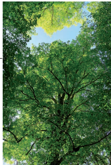
Alte Bäume, ein Schatz der Natur.

Auf dem Erlebnisraum-Gelände rund um den Pfarrhof finden sich viele gewaltige und besondere Baumgestalten, aber auch kleinere und unauffällige Baumarten. Auf unserer Wanderung lernen wir die Baumarten kennen: wie erkenne ich sie, wo kommen sie von Natur aus vor, wie ist ihre Ökologie, welche Netzwerke spinnen sie, und für welche Tierarten sind sie als Lebensraum besonders wichtig? Zudem erfahren wir interessante Dinge über die forstliche Nutzung und die Bedeutung der Bäume in Mythologie und Sagen. Mit Dr. Katrin Romahn .