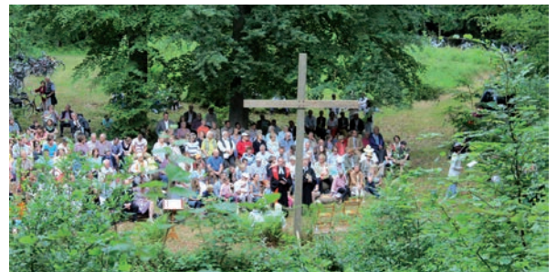
Gottesdienst in der Glinde