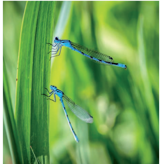
Libellen, Foto: alexurs adobe stock

Der Artenschutzreferent des Naturschutzbundes NABU und Insektenexperte Thomas Behrends geht mit uns auf Insektensuche – wo sind Insekten überall zu finden, wie leben sie, wie ernähren sie sich? Käfer, Bienen, Hummeln, Libellen... kennst du die häufigsten Arten? Vorsichtig spüren wir die Insekten auf, beobachten sie in Becherlupen und staunen, was die kleinen Krabbler alles können.