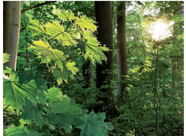
Wie wird der Wald der Zukunft aussehen und welche Rolle spielen Baumarten wie der Spitzahorn?