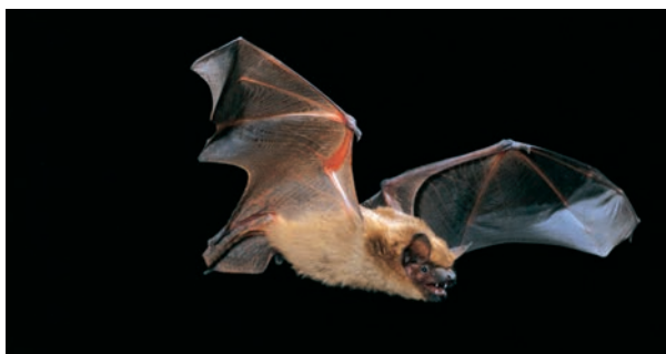
Breitflügelfledermaus, Foto: ©Nill

Zusammen mit der Biologin Sonja Fuhrmann vom Naturpark Holsteinische Schweiz gehen wir nach einer Einführung zu heimischen Fledermäusen auf Entdeckungsreise: Mit Ultraschall-Detektoren werden wir die Jagdrufe der nächtlichen Flattertiere belauschen.