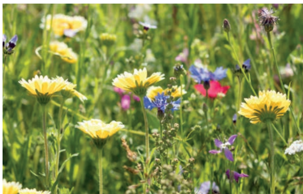
Wildkräuterwiese