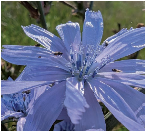
Wunderwerk Blüte – neu entdeckt!

Meist gehen wir achtlos an ihnen vorbei: wer achtet schon auf Kräuter und Gräser in unserem täglichen Umfeld? Wer sich jedoch darauf einlässt, entdeckt plötzlich eine ungeahnte Formenvielfalt und Schönheit, wo zuvor nur „grün“ wahrgenommen wurde. Auf unserer Wanderung durch den Erlebnisraum entdecken wir verschiedenste Pflanzenarten: wie erkenne ich sie, welche besonderen Überlebensstrategien haben sie, welche Bedeutung weisen sie im Naturhaushalt auf? Schnappen Sie sich eine Botanik-Lupe (wird gestellt) und tauchen Sie ein in das erstaunliche Mikro-Universum vor unserer Haustür. Bitte Leselupen mitbringen, falls vorhanden. Mit der Botanikerin Dr. Katrin Romahn .