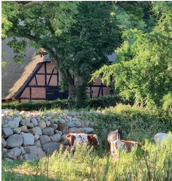
Der Naturerlebnisraum Historischer Pfarrhof – Artenvielfalt in einer traditionellen Kulturlandschaft, mitten in Schönwalde.