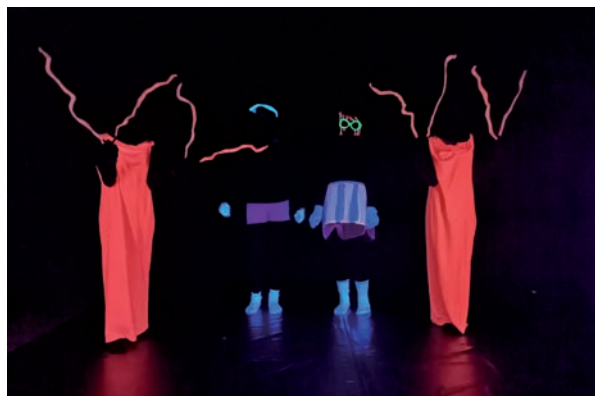
Mit Schwarzlicht lassen sich überraschende Effekte zaubern.

Dieses Projekt ist ein Bildungsangebot, um das Klimaschutzverhalten zu stärken. Musik-Videos sind bei Instagram unter Schwarzlichttheater Eutin zu sehen.