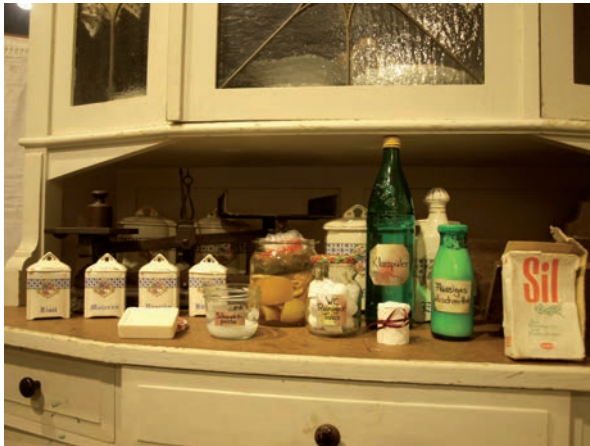
Haushaltshelfer wie zu Omas Zeiten – gewusst wie!