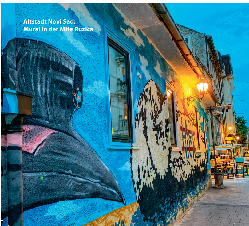
Altstadt Novi Sad: Mural in der Mite Ruzica

Das Mittelgebirge Zlatibor liegt rund 240 Kilometer westlich von Belgrad. Sein höchster Gipfel, der Tornik, scheidert um vier Meter an der 1.500er-Hürde. Die Bergregion ist für ihren Reichtum an Heilkräutern wie Johanniskraut, Tausendgüldenkraut oder Gelber Enzian bekannt. Der Ort Zlatibor selbst wirkt mit Dutzenden Hochbauten,