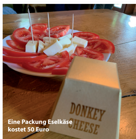
Eine Packung Eselkäse kostet 50 Euro