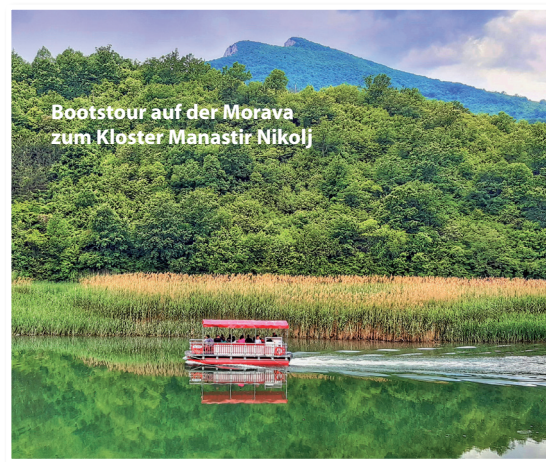
Bootstour auf der Morava zum Kloster Manastir Nikolj