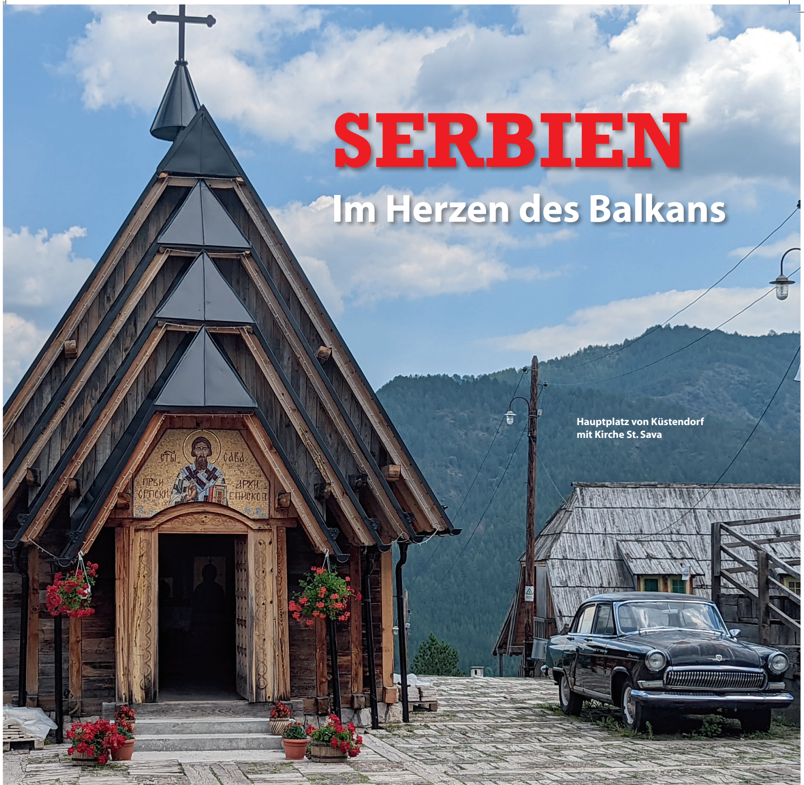
Hauptplatz von Küstendorf mit Kirche St. Sava

Serbien-Mix: Die artenreichen Marschen der Zasavica. Die weinseligen Hänge der Fruška Gora. Das bunte Novi Sad. Die mäandertrunkene Ovcar-Kablar-Schlucht. Die Berge von Mokra Gora mit verrücktem Küstendorf. Plus der teuerste Käse der Welt!