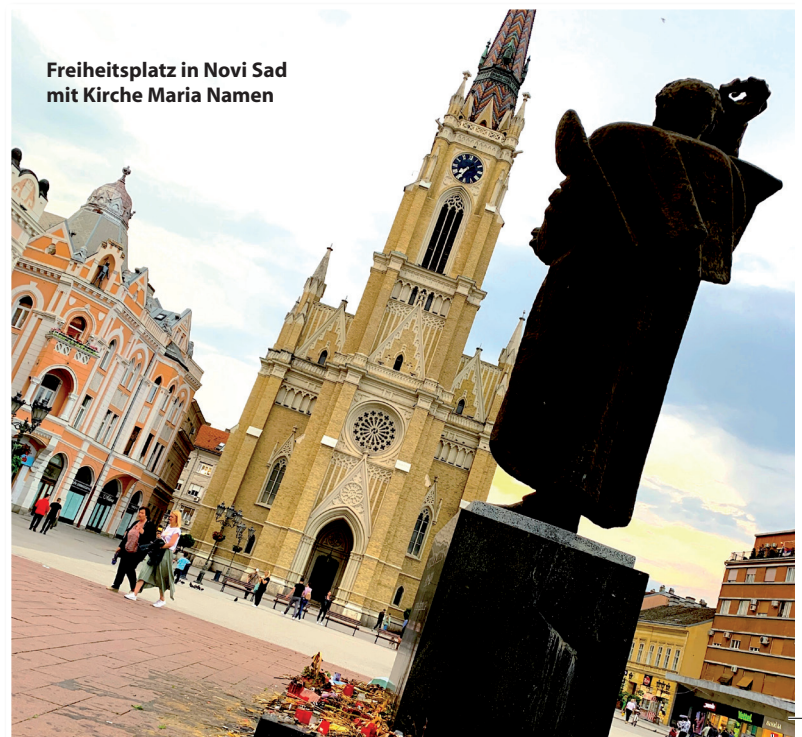
Freiheitsplatz in Novi Sad mit Kirche Maria Namen