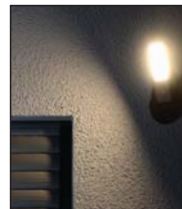
LED-Leuchte manuell, bei Bewegung oder nach Zeitplan schaltbar