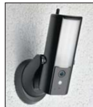
Lichtkamera zur Wandmontage im Außenbereich