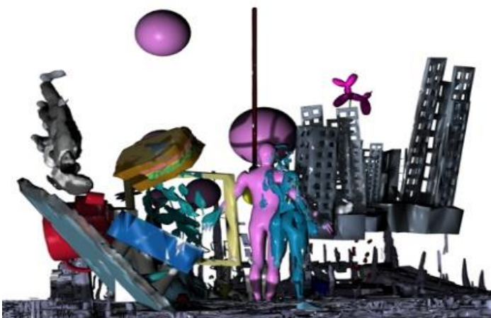
Abbildung 5: Stephan Bruehlhart, Art As Experience , 2021, VR-Installation, VR Brille Quest 2, digit. Druck auf Teppich (90 cm)