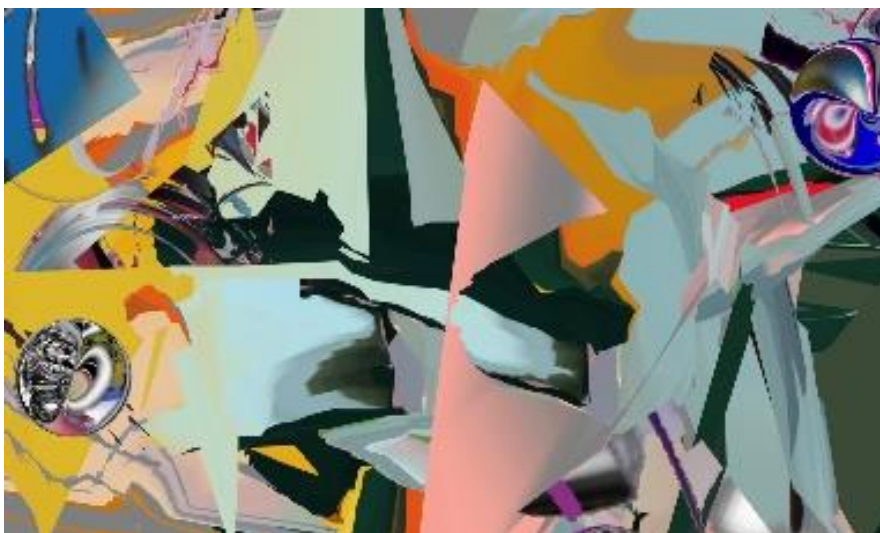
Abbildung 2: Gigga Hug, Life in a Bubble, tanzend , 2023, Digitalfotografie, 50 x 83.4 cm