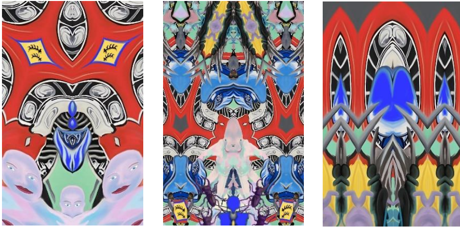
Abbildung 6: Stephan Bruehlhart, Reliquie 1-3 , 2022, Mischtechnik auf Leinwand, je 160 x 100 cm