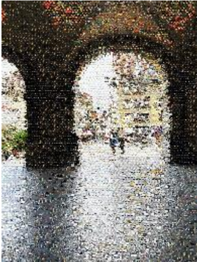
Abbildung 3: Gigga Hug, City Life Emojis , Kornhausplatz, 2022, Digitalfotografie, 21 x 29.7 cm