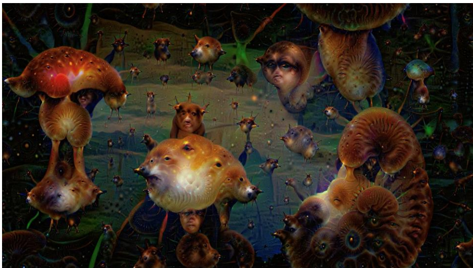
Abbildung 7: Alexander Mordvintsev, Fungi Kingdom , 2020, MP4