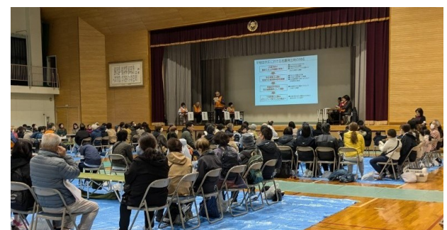
生活避難場所の運営説明（地震発生時の対応）