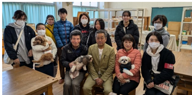
ペット同伴避難ワークショップの参加者