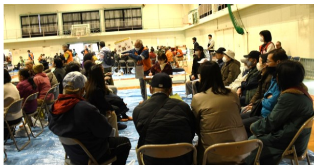
グループ毎の意見交換(牛田早稲田4丁目グループ)