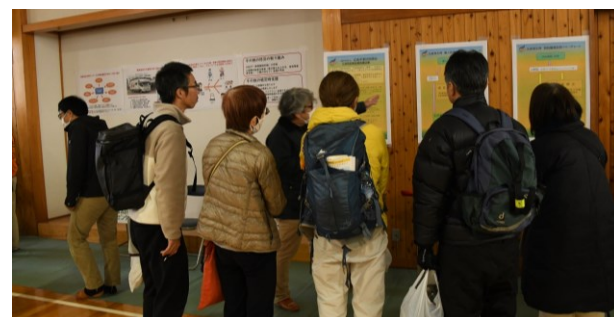
ポスターセッションの説明（東区医師会）