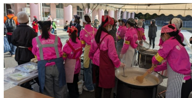
大和重工の大鍋による炊き出し訓練（広島女学院大学協力）