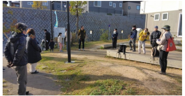
牛田早稲田第8公園での集合状況