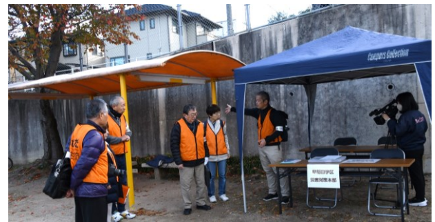
災害対策本部の設置状況