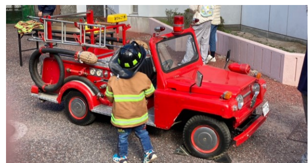
ミニ消防車の試乗体験（広島東消防署協力）