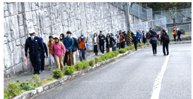
東警察署の協力による避難移動訓練