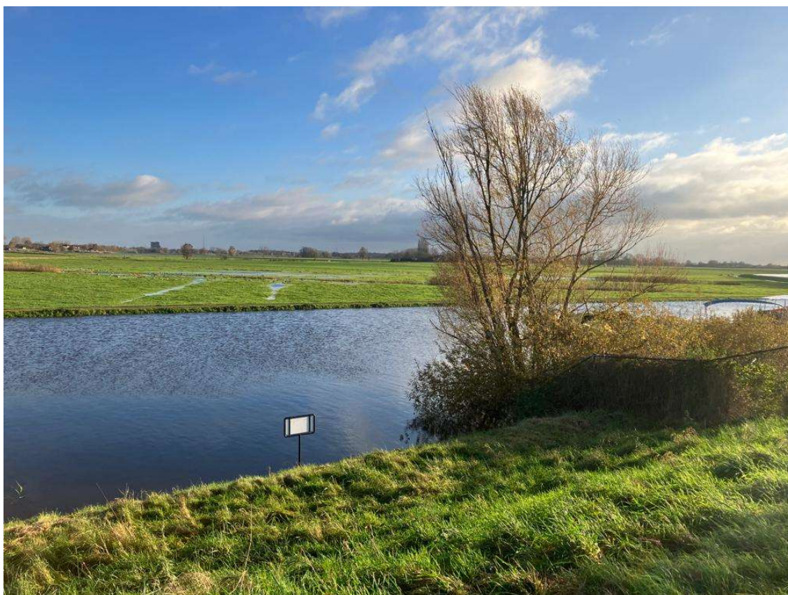
Blik op de Homoet met zicht op het Apeldoorns Kanaal en de kade gezien vanaf de dijk.