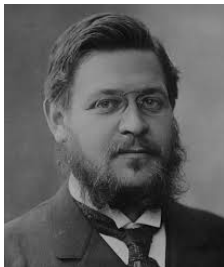
Albert Thomas (1878-1932)

Professeur d'histoire-géographie, militant socialiste à partir de 1903, il écrit des articles dans L'Humanité, le journal fondé par Jean Jaurès dont il est proche. Il participe au gouvernement d'Union sacrée dès 1914 au poste de Sous-secrétaire d'État chargé de l'Artillerie puis de Ministre de l'Armement. Après la guerre, il devient le premier directeur du Bureau international du travail.