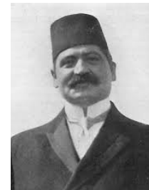
Mehmet Talaat Pacha (1874-1921)

Née à Varsovie, elle arrive à Paris en 1891 pour faire ses études de sciences physiques. En 1894, elle rencontre son futur mari, Pierre Curie. Elle obtient le Prix Nobel de physique en 1903 puis le Prix Nobel de chimie en 1911. Elle participe à l'effort de guerre en concevant des voitures équipées d'appareils de radiologie pour faciliter les opérations chirurgicales sur le front.