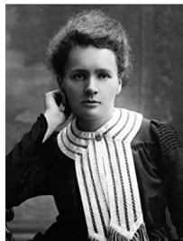
Marie Curie (1867-1934)

Professeur d'histoire-géographie, militant socialiste à partir de 1903, il écrit des articles dans L'Humanité, le journal fondé par Jean Jaurès dont il est proche. Il participe au gouvernement d'Union sacrée dès 1914 au poste de Sous-secrétaire d'État chargé de l'Artillerie puis de Ministre de l'Armement. Après la guerre, il devient le premier directeur du Bureau international du travail.