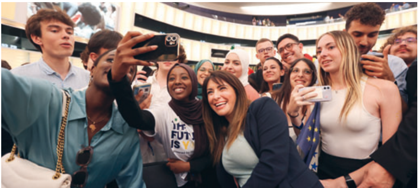
European Youth Event 2023

https://european-youth-event.europarl.europa.eu/de/