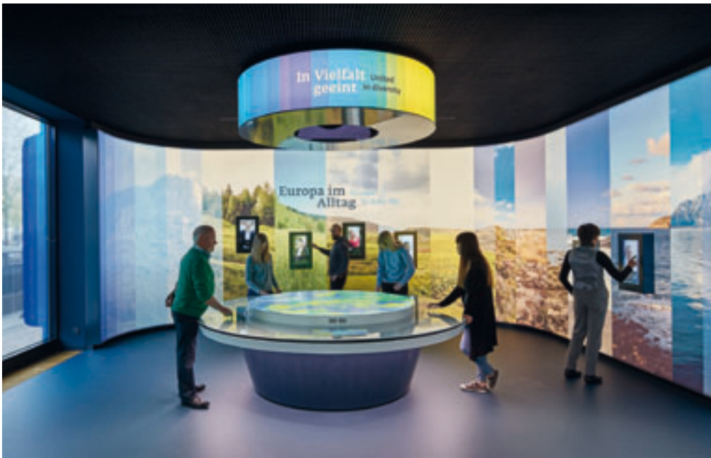
ERLEBNIS EUROPA im Europäischen Haus in Berlin