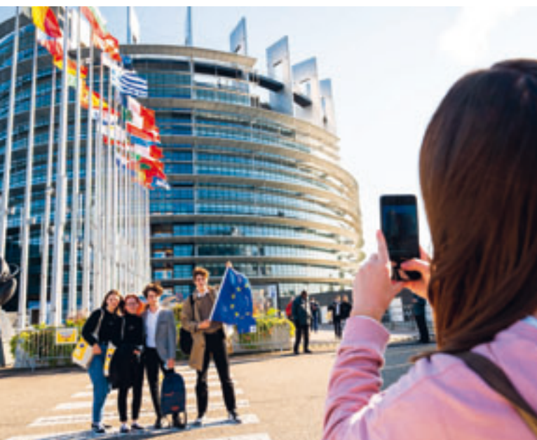
Besuch im Parlament

https://youth.europarl.europa.eu/de/more-information/euroscola.html