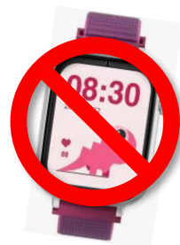
Bild- und Tonaufnahmen sind verboten.

Bei Regelverstößen werden die Eltern zum Gespräch eingeladen.