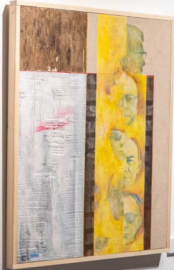
LOUISE BOURGEOIS Untitled (1991) Oil on paper, 11 x 11 in.