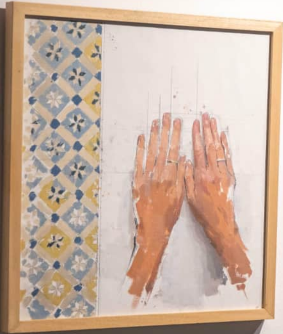
LOUISE BOURGEOIS Hands (1991) Oil on paper, 11 x 11 in.