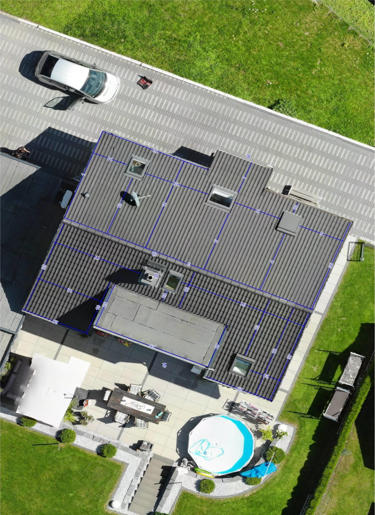
Bild mit Nummerierung