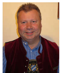
Bühnenbau (Anton Schweikl)