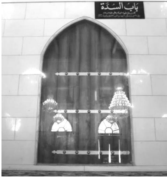
Mezquita aljama de Kufa: Bāb al-sudda (como indica el letrero con fondo negro, sobre la puerta)

Pero esto no sería la única interpretación posible, pues cabría pensar que el nombre de Sudda quizás designe también una puerta que podía cerrarse: en el libro de Tāy al-Dīn Abū l-Faḍl ibn al-Nu'mān al-Anṣārī (m. 1089) Awḍaḥ al-masālik ilā ma'rifat aḥkām al-manāsik («El más claro camino para conocer las reglas de los lugares de devoción») 60 podemos leer que, en la mezquita de La Meca, la Bāb al-sudda se llamó así porque estaba cerrada ( sudda ), y luego fue abierta; y la puerta 'de la Zuda' de la mezquita de Kufa se llamó así ( al-sudda ) porque a veces permanecía cerrada; de esta manera se aprecia en fotografías actuales 61 .