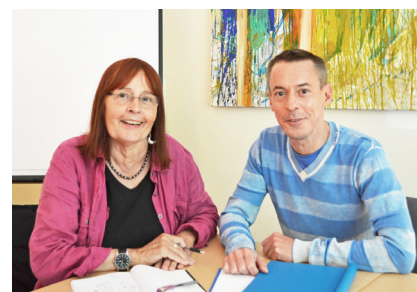
Das generationsübergreifende Leitungsteam von Now&Next

engagiert sich für Kinder, Erzieherinnen, Kitas und Träger