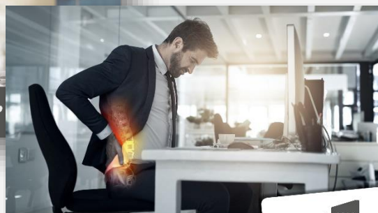
Kreuz- und ISG?