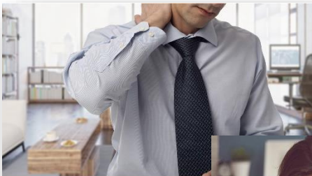
Schulter- und Nacken?