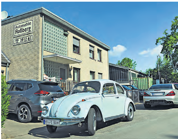
Ob Alt/Gebraucht-, Neu- oder Unfallwagen. Automobile Roßberg kümmert sich um die individuellen Wünsche der Besitzer.

Seit Mitte der 80er Jahre gehört ferner eine Kfz-Meisterwerkstatt zum Unternehmen. „Wir sind mit modernsten Diagnosegeräten ausgestattet und bieten Ihnen kostengünstige und fachgerechte Reparaturen“, betont der Chef.