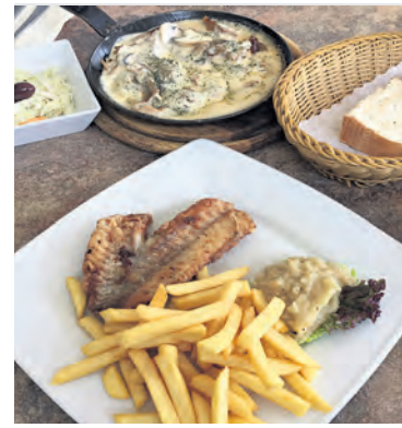
Im Restaurant „Poseidon“ fühlt man sich wie im kulinarischen Urlaub in Griechenland.

Urlaub in Griechenland - das ist Gastfreundschaft und gutes Essen. Aber muss man ins Flugzeug steigen, um beides zu genießen? Nicht unbedingt. Eine perfekte Alternative befindet sich schon seit Jahren in der Gröpelinger Heerstraße 115. Das griechische Restaurant „Poseidon“ ist eine feine Adresse, um das ganze Repertoire an griechischen Spezialitäten zu genießen. Landestypische Vorspeisen oder Mezedes, wie der Grieche sagt, sind beim Team des Restaurants genau so erhältlich, wie Gerichte vom Grill, aus der Pfanne oder dem Backofen. Lamm, Schwein, Kalb - im „Poseidon“ kommt alles frisch zubereitet auf den Tisch. Der Namensgeber des Restaurants ist bekanntlich der Gott des Meeres - da ist es auch nicht weiter verwunderlich, dass man auf der Speisekarte eine große Auswahl an Fischspezialitäten findet. Und um Poseidon richtig zufrieden zu stellen, wurde der Montag zum Scampitag