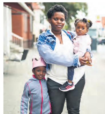
Eines der Bilder aus der Ausstellung.

Zu sehen sind die Arbeiten von Aleksandra Weber bis zum 8. Juli zu den Westend-Öffnungszeiten (Waller Heerstraße 294) montags bis donnerstags von 10 bis 18 Uhr und freitags von 10 bis 13 Uhr. (mb)