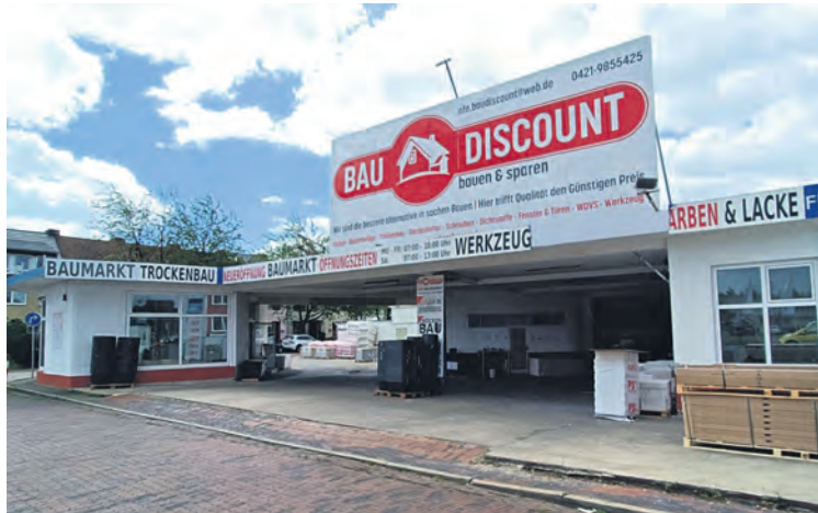
Mit „Drive-In“ gut zu erreichen und schnell zu beladen.

Farben, Lacke und Zubehör: Auch professionelle Maler und Lackierer finden im Bau-Discount ein umfangreiches Sortiment zur perfekten Erledigung der anstehenden Aufträge vor. Sie benötigen einen speziellen Farbton? Mit der Farbmischanlage produzieren die Fachverkäufer ihren gewünschten Werkstoff in dem benötigten Farbton.