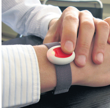
Im Notfall wird der Pieper gedrückt.

Bei akuten medizinischen Notfällen wird ein Rettungswagen gerufen. „Für Menschen, die sich unterwegs unsicher fühlen, haben wir auch mobile Notrufgeräte“, sagt Wallschlag. Der Hausnotruf ist 24 Stunden jeden Tag im Jahr erreichbar.