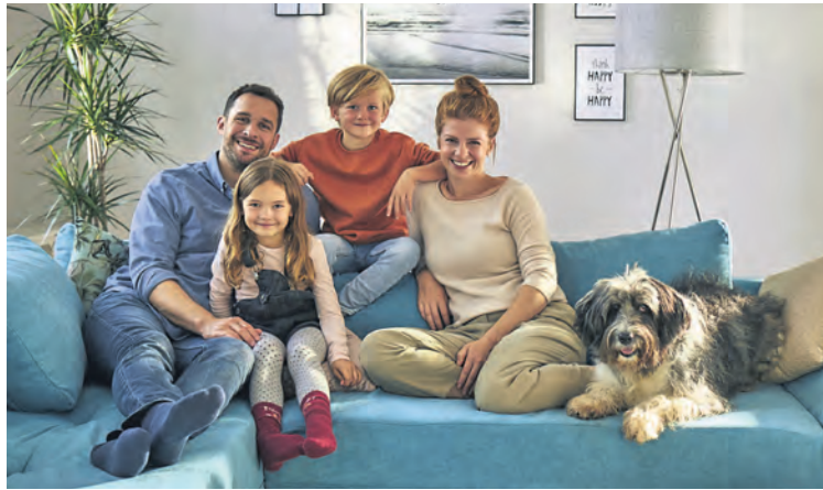
Inspiration und Einrichtung für die ganze Familie gibt es bei Roller.

Die 111 Standorte des ROLLER-Marktes finden sich in Städten von A wie Alsfeld bis Z wie Zöllnitz wieder und bieten ihrer Kundschaft attraktive und innovative Wohnlösungen zu einem unschlagbaren Preis-Leistungsverhältnis. Darüber hinaus gilt Roller als erster echter Omnichannel-Anbieter des