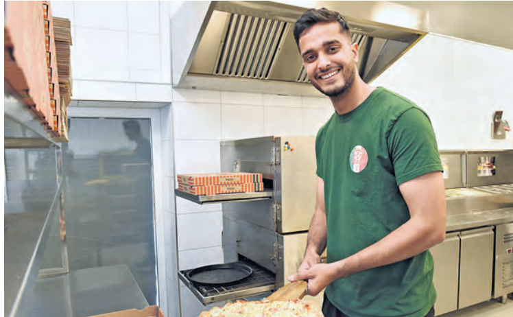
Unwiderstehlich lecker: Nur qualitativ hochwertige Zutaten werden vom Team von My Pizza verwendet.