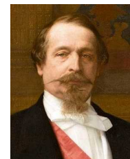
Louis Napoléon Bonaparte (1808-1873)

Mariée à un baron, elle devient une femme indépendante dans les années 1830. Amie de nombreux artistes romantiques (Chopin, Musset), elle écrit des romans et est aussi proche des milieux socialistes dont elle soutient la révolution de 1848. Sous le Second Empire, elle se consacre à son œuvre littéraire et à sa correspondance.