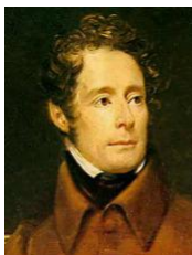
Alphonse de Lamartine (1790-1869)

Aristocrate, poète, il est député dès 1833. Il joue un rôle majeur dans la révolution de février 1848, imposant le drapeau tricolore et devenant Ministre des affaires étrangères. Mais il est dépassé par les événements de juin et est battu aux élections présidentielles de 1848. Il se retire de la vie politique après le coup d'état de 1851.