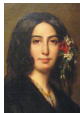
George Sand (1804-1876)

Aristocrate, poète, il est député dès 1833. Il joue un rôle majeur dans la révolution de février 1848, imposant le drapeau tricolore et devenant Ministre des affaires étrangères. Mais il est dépassé par les événements de juin et est battu aux élections présidentielles de 1848. Il se retire de la vie politique après le coup d'état de 1851.