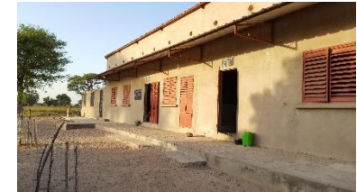
Ecole élémentaire de Sand

66 % déduit de votre imposition sur présentation d'un reçu fiscal. Dans la limite de 20 % de votre revenu.