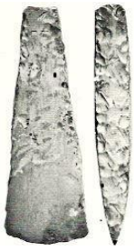
Dicknackiges Flintbeit Rosdorf, ca. 14 cm