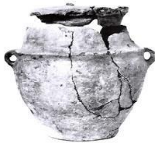
Tongefäß Höhe 11,8 cm Durchmesser 12,1 cm