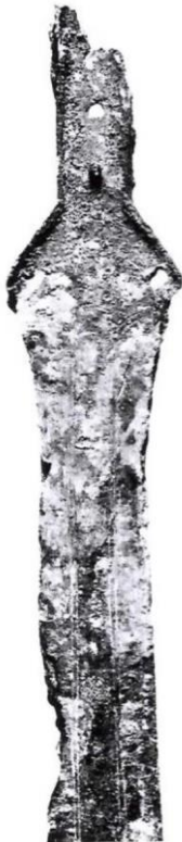
Bronzezungengriffsschwert Länge 54,5 cm Breite des Heftes 5,2 cm