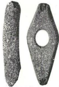
Kleine Streitaxt Jütländer Form L = 10,1 cm