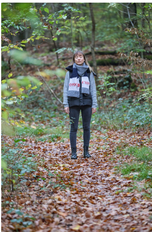
In der Ruhe ankommen: Wer die Wirkung des Waldes spüren will, muss sich zuerst darauf einlassen

„Auch das Thema inneres Kind spielt eine Rolle. Wieder ins Staunen, in die