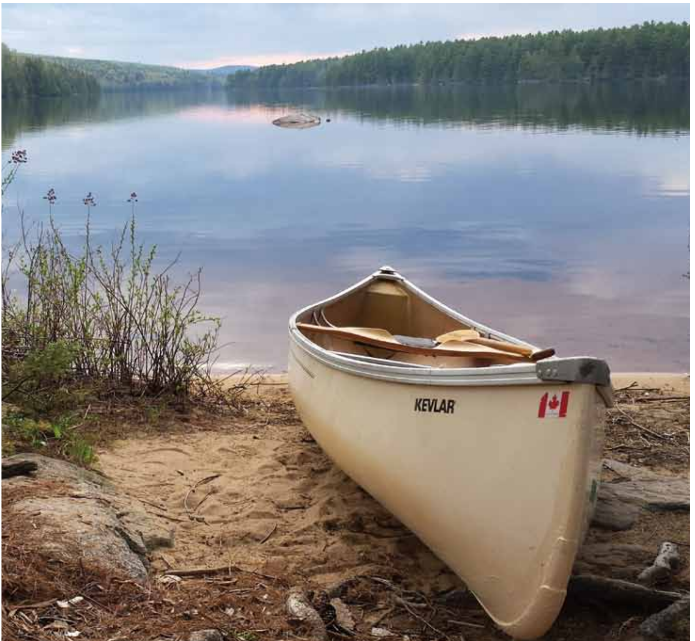
オンタリオ州アルゴンキン州立公園でのカヌーキャンプ Canoe camping at Algonquin Park, Ontario

ホームページ: https://www.hiroshima-canada.org/