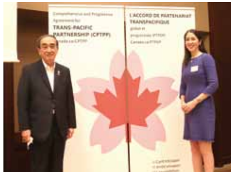
刈田会長とマリナー等書記官 President Karita and First Secretary Mallin

CPTPP：Comprehensive and Progressive Agreement for Trans-Pacific Partnership The CPTPP is a free trade agreement implemented in 2018 which is also called the TPP11. The Trans-Pacific Partnership (TPP) initially included 12 nations, but with the withdrawal of the United States by the Trump Administration, the treaty now includes 11 nations.