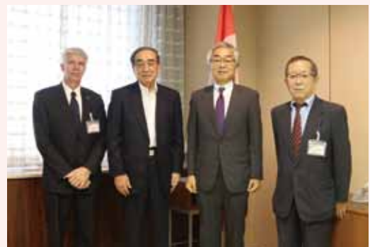
齊藤総領事 (右から二人目) Consul General Saito (Second from right)

It was a fruitful meeting for all involved.