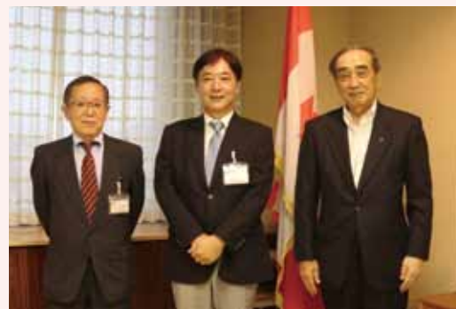
伊澤前総領事 (中央) Former Consul General Izawa (Centre)