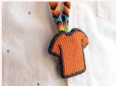
オレンジを着よう Wear orange