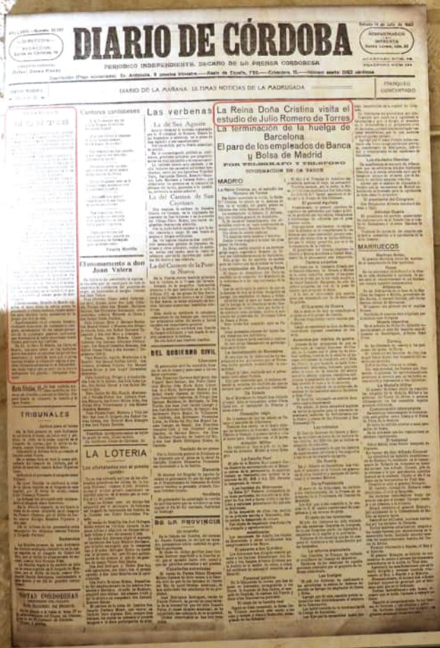
"Diario de Córdoba", 14 / julio / 1933