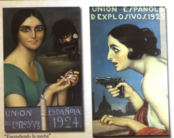
"Encendiendo la mecha"