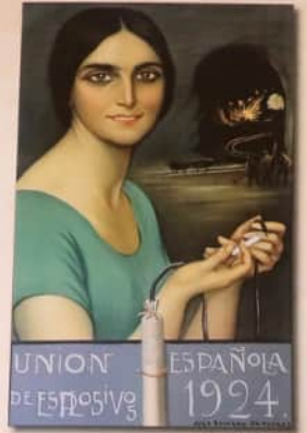
"Encendiendo la mecha"