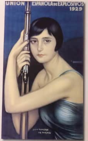
"La escopeta de caza"