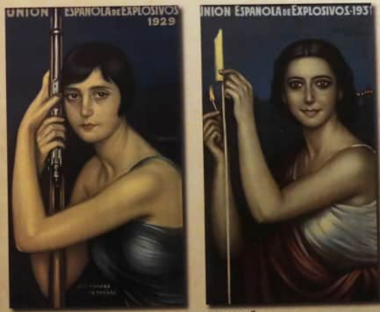
"La escopeta de caza"