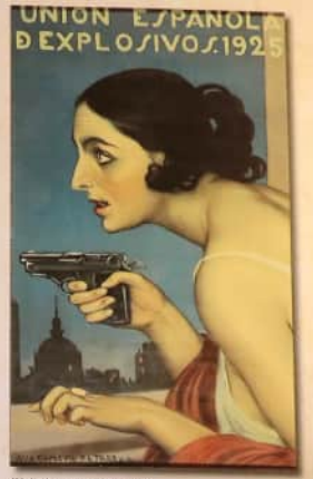
"Mujer con Pistola"