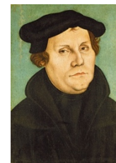
Martin Luther (1483-1546)

Sculpteur, peintre, architecte et poète italien, Michelangelo Buonarroti travaille pour Laurent de Médicis à Florence (il sculpte le David ). En 1508, le pape Jules II le charge d'orner le plafond de la Chapelle Sixtine avec des scènes de la Genèse mais aussi le mur oriental de la chapelle avec la scène du Jugement Dernier.