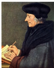
Didier Érasme (1469-1536)

Moine humaniste hollandais, il étudie la théologie à l'Université de Paris puis est ordonné prêtre en 1492. Érasme renonce à la carrière ecclésiastique pour se consacrer aux études : il multiplie les enseignements dans les universités et publie en 1516 la première édition critique du Nouveau Testament .