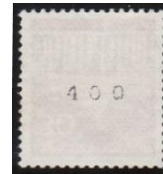
Los Nr. 520