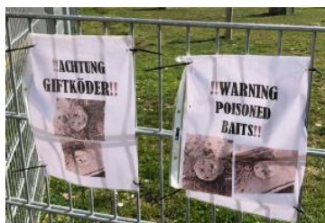
In der Hundezone Blumauerstraße hat sich die Lage entspannt.