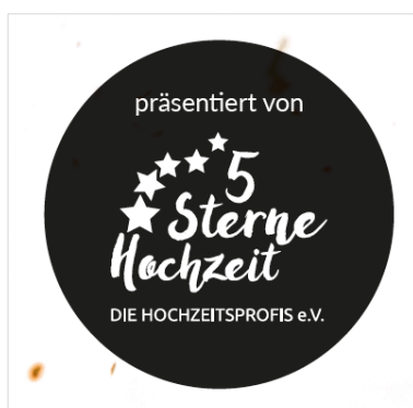
Bsp.: "Präsentiert von" 2023

Dann nutze die einmalige Chance und werde Kooperationspartner!