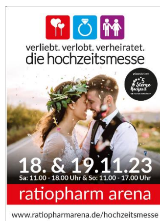
Bsp.: Plakat 2023