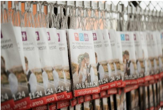
Bsp.: Unsere Welcome-Bags 2024

Aussteller bis 20 g: 250,- Euro, bis 100 g: 400,- Euro / Nicht-Aussteller bis 20 g: 500,- Euro, bis 100 g: 1000,-Euro