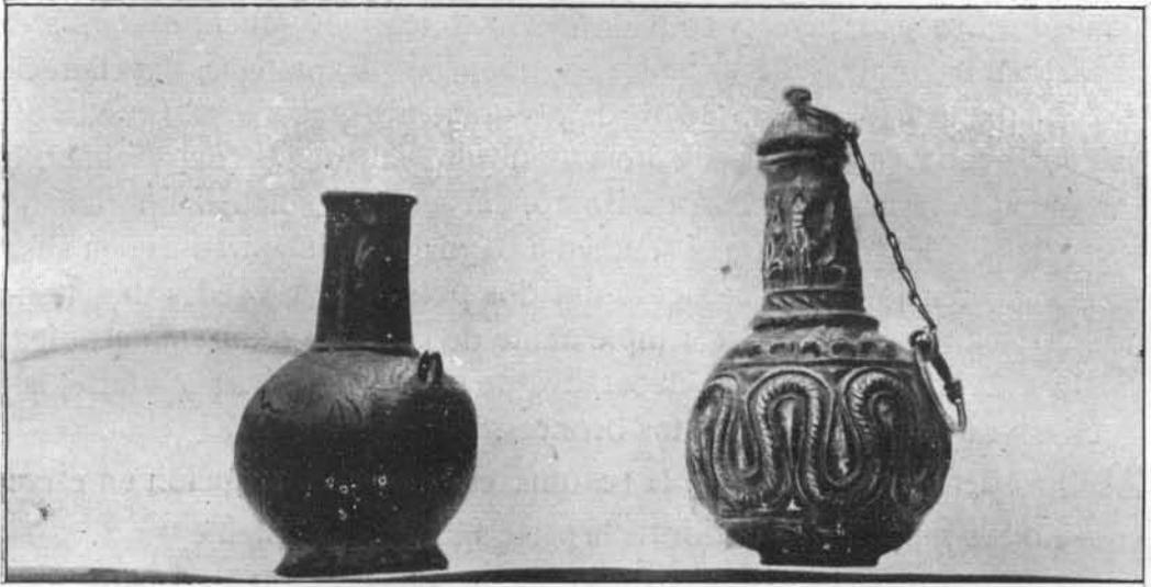
Fig. 1.—Redoma de bronce con inscriptón (a la izquierda) de que se da cuenta en este artículo. A la derecha la redoma de plata hallada en los Olivos Borrachos, también inmediato a Córdoba.