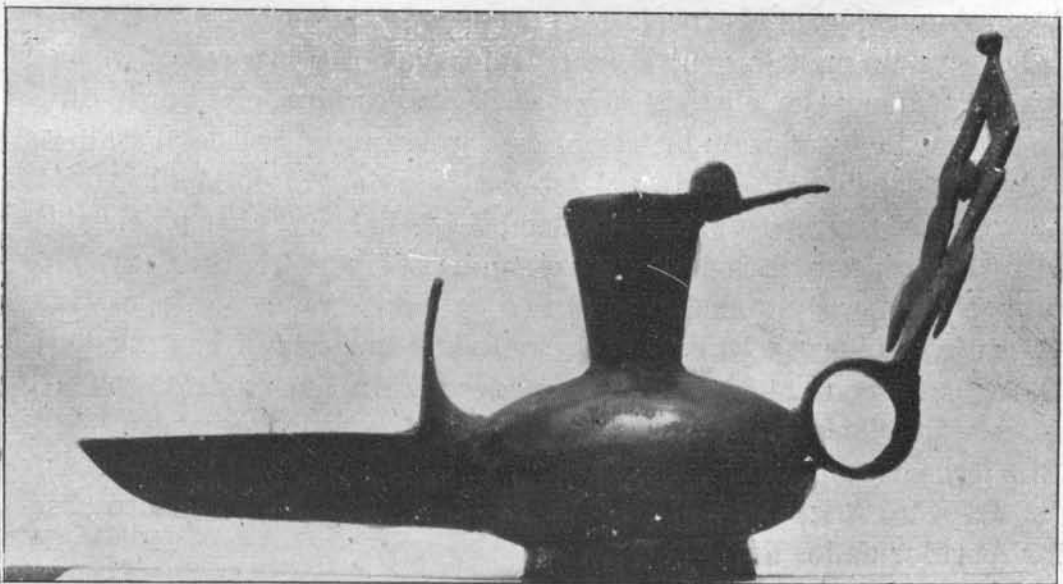
Fig. 4.—Candil de bronce hallado en Rabanales (Córdoba).

Responden todos ellos a los conocidos tipos de barro que aparecen por centenares en las excavaciones: uno es el tipo de recipiente esférico, gollete estrecho y abocinado en su boca, asa anular pegada al borde de la boca y a la parte alta de la panza. La piquera es larga, profundamente acanalada y con un apéndice para colgar el escarbador de la mecha. De