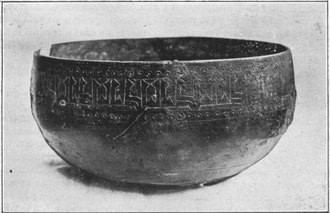
Fig 2.—Cazoleta con inscripci3n hallada en Almiria, inmediato a Córdoba.