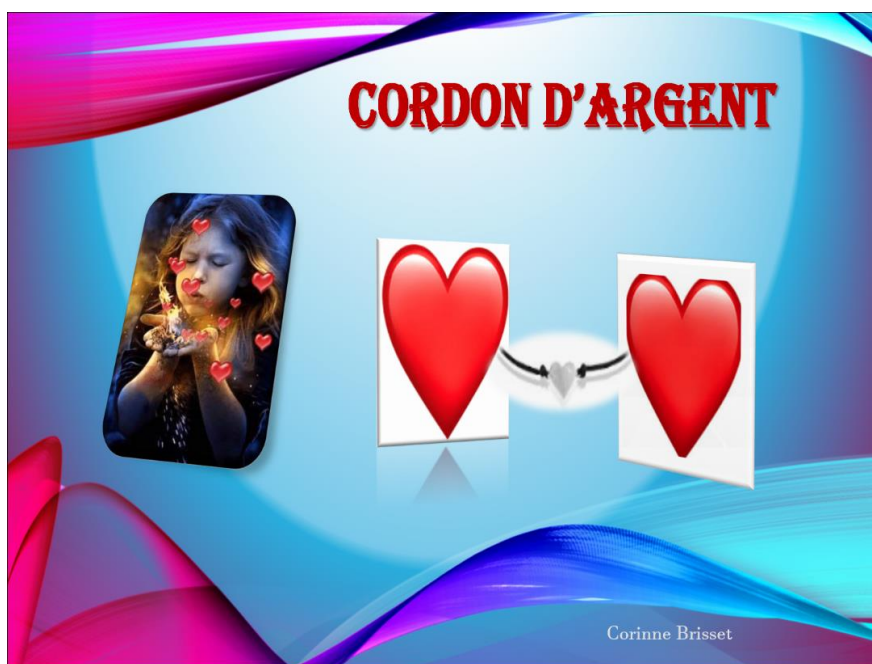
photo. Respirez calmement et profondément, lorsque vous vous sentez prêt et complètement détendu, à l'inspire votre boule d'Amour quitte votre cœur et suit ce cordon d'argent jusqu'au cœur de votre animal.

Durant tout ce temps, parlez-lui en l'appelant par son nom. Expliquez-lui votre inquiétude, tout ce que vous ressentez pour lui et sur la situation que vous vivez du fait de son absence. Ce déchirement de ne plus l'avoir à vos côtés. Combien il vous manque ! Vous pouvez contempler son retour et votre allégresse à le retrouver et le serrer dans vos bras. Demandez-lui de revenir vers vous en se laissant guider par ce cordon d'Amour tout en étant attentif à cause de la circulation.