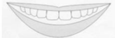
B: 上顎の歯を見せたまま口を開けた笑顔 (下の歯はみえない状態)