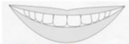
A: 下唇を上顎前歯の切端に沿わせた笑顔