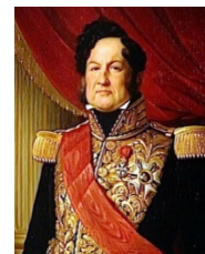
Louis Philippe I er (1773-1850)

Révolutionnaire, patriote et fervent républicain et partisan de l'unité italienne, il combat toute sa vie pour la concrétisation de l'unité italienne et pour l'instauration d'une république. Membre d'une société secrète (les Carbonari) à partir de 1827, il entre dans la clandestinité et la lutte politique. Chef du mouvement « Jeune Italie », il est contraint de s'exiler en France en 1831.