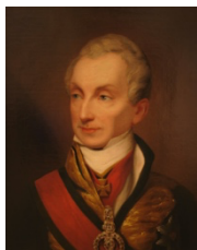
Klemens von Metternich (1773-1859)

Issu de la noblesse allemande, il fait ses études à Strasbourg mais s'oppose à la Révolution puis est contraint de fuir à Vienne. Ambassadeur à Berlin en 1803 puis à Paris en 1806, il devient le Ministre des affaires étrangères autrichien en 1809 et organise le congrès de Vienne à ce titre. Il est nommé Chancelier en 1821 et exerce le pouvoir jusqu'en 1848 où il est chassé du pouvoir lors de la révolte des Viennois.