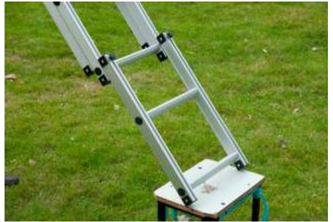
Leiter-Verlängerung um 54cm (geeignet für Offroad Fahrzeuge ab 210cm )