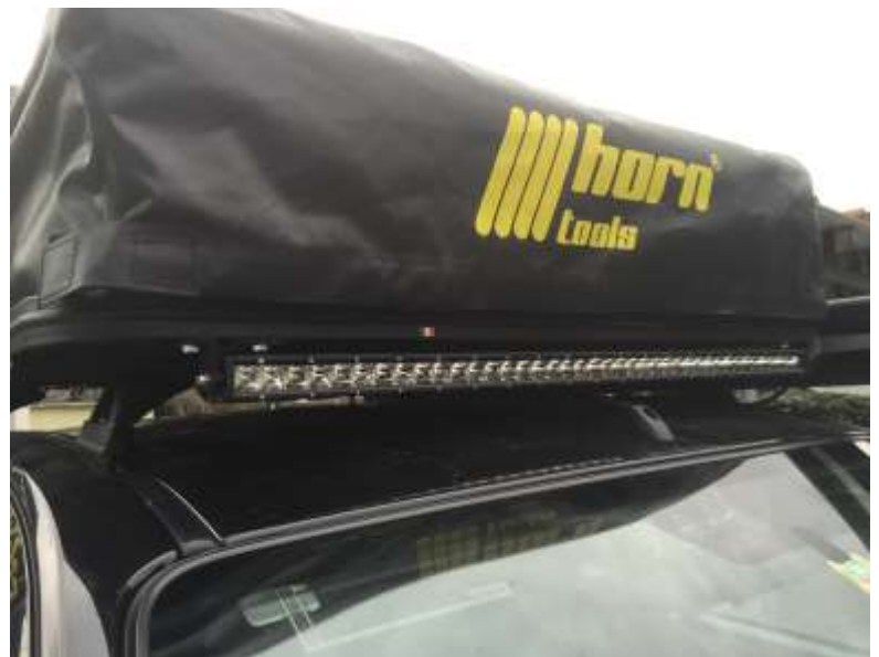
Dachzelt-Abdeckung mit Reißverschluss

120/140cm x 120cm x 40cm Artikelnr.: PHRTCOVER140