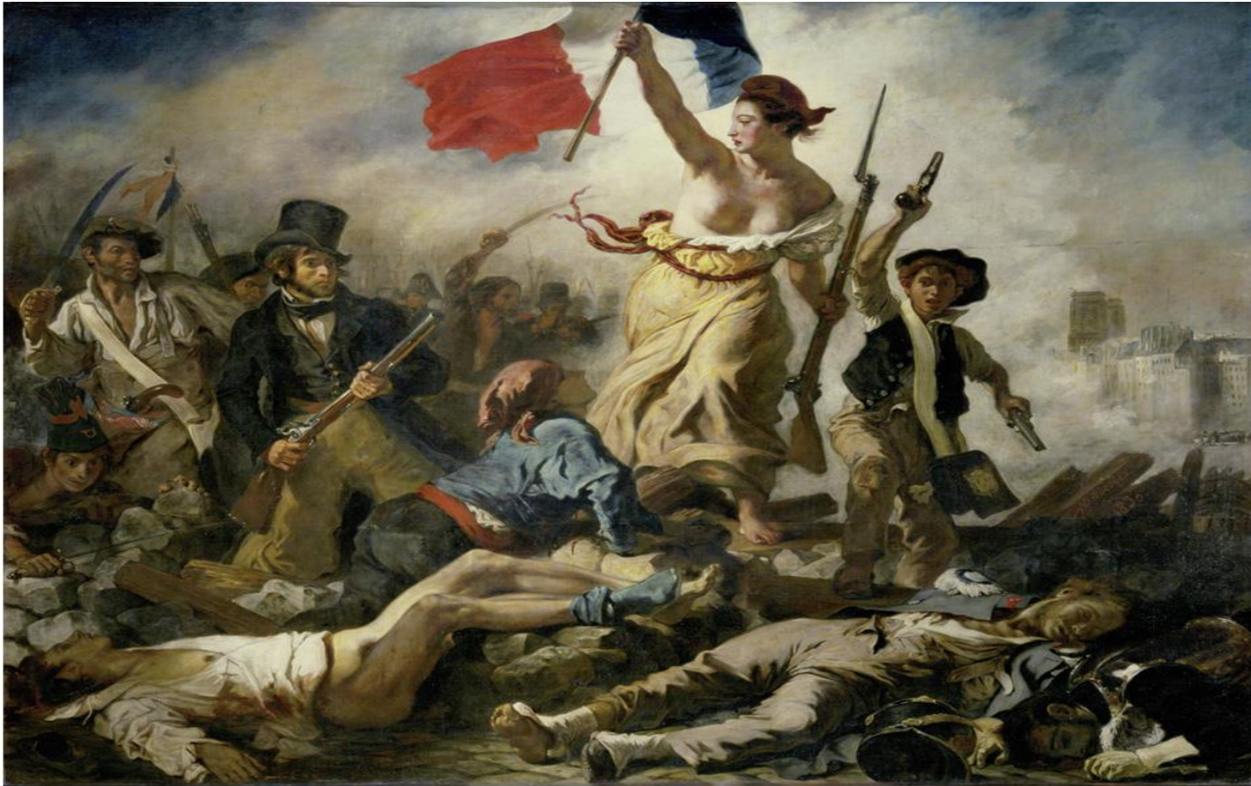
Eugène Delacroix, La Liberté guidant le peuple (Die Freiheit führt das Volk), 1830, Musée du Louvre