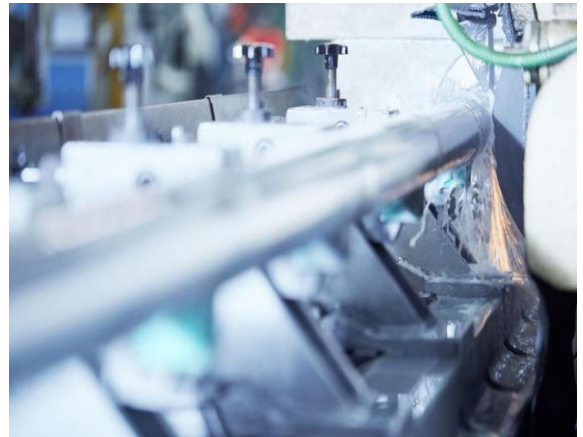
Drehen | Schweißen | Montieren | Kontrollieren