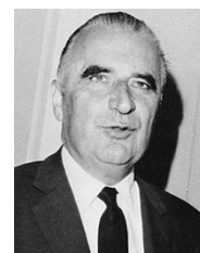
Georges Pompidou (1911-1974)

Député radical, il participe au Front populaire. En 1940, il est emprisonné par Pétain puis rejoint la résistance. Entre 1954 et 1955, il dirige le gouvernement. Il négocie la paix avec l'Indochine. En 1958, il s'oppose au retour de de Gaulle.