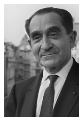
Pierre Mendès-France (1907-1982)

Général, chef de la France libre, il préside le Gouvernement provisoire de 1944 à 1946. Rappelé au pouvoir en 1958 lors de la crise algérienne, il fonde la V e République et en devient le Président. Il occupe cette fonction jusqu'en 1969.