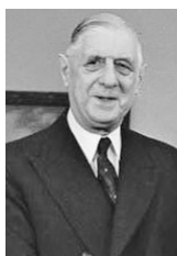
Charles de Gaulle (1890-1970)

Résistant gaulliste, il est sénateur de 1948 à 1958 puis il devient Garde des Sceaux avec le retour du général de Gaulle au pouvoir en 1958. Il rédige la constitution de 1958 puis occupe la fonction de Premier Ministre de 1959 à 1962.