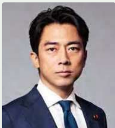
基調講演／パネリスト 小泉 進次郎氏 (衆議院議員 元環境大臣)