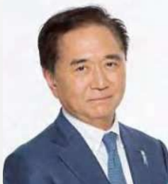
コーディネーター 黒岩 祐治 (神奈川県知事)