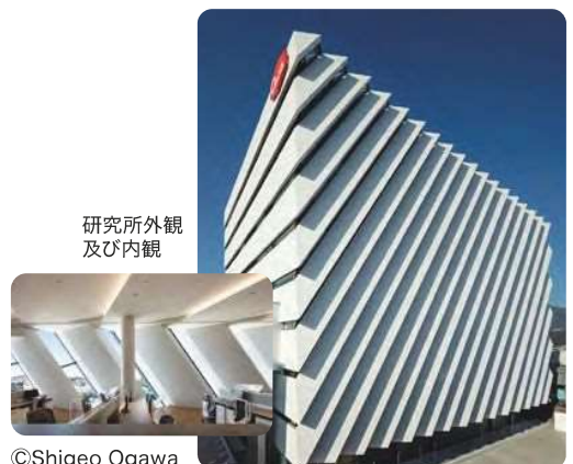
研究所外観 及び内観

令和2年に伊勢原市内に竣工した生命科学研究所新棟において、照明の自動制御や床吹き出し方式の空調設備の採用等、室内環境向上に配慮するとともに、冷温水同時取出型チラーやデシカント空調機等の採用により、省エネルギーを図っている。さらに、用途別にエネルギー消費量を把握・分析可能な計画とし、節水器具やリサイクル材等を採用するなど、環境負荷削減に配慮し、県建築物温暖化対策計画書制度における評価システム(CASBEE ® )では最高のSランク評価となっている。