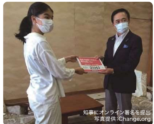
知事にオンライン署名を提出

高校生が脱炭素に関する問題意識をもち、自らできること及び効果的な手法を考えて行動に移したこの取組は、県立高校における再エネ電力導入の推進に対する後押しとなり、令和5年度には県内の全県立高校で再エネ由来の電力となった。