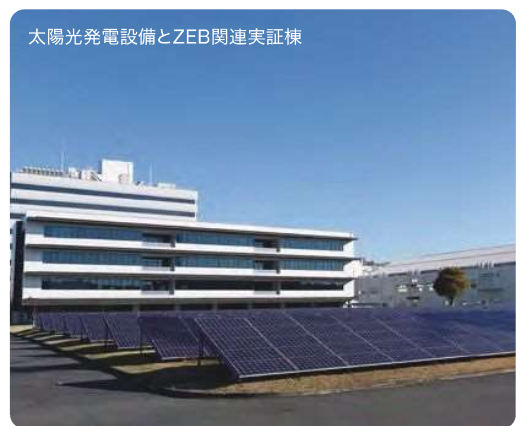
太陽光発電設備とZEB関連実証棟

鎌倉市内等の事業所において、再生可能エネルギーの導入を積極的に行うとともに、高効率な空調設備、変圧器、圧縮機等への更新や、自社で開発したZEB技術や電力監視技術を活用することで、事業所の省エネを推進している。また、ZEB技術のアピールも広く行っている。計画最終年度となる令和3年度は、これらの取組により基準年度(平成30年度)に対して約16%と、CO 2 排出量の大幅な削減を実現した。