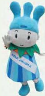
かながわ しずくちゃん

10:30~11:00/12:00~12:30/13:30~14:00/15:00~15:30