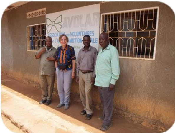
Vor dem AVOLAR-Büro in Mbanza-Ngungu

Für stark interessierte gibt es auch eine Mitgliedschaft für 30CHF (Rentner/IV) und 50CHF.