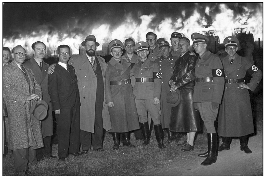
Am 2. April 1938 wurden Objekte des in „Wöllersdorf-Trutzburg“ umbenannten Anhaltelagers im Zuge einer propagandistischen Großveranstaltung in Brand gesetzt. Ebenfalls am 2. April traf der erste Transport mit 150 österreichischen Häftlingen im KZ Dachau ein.

ebenso langweilig wie von kasernierten Soldaten, die keinen Dienst zu machen brauchen. Es gab weder Zellen noch Pritschen. Alle Häftlinge, meist junge Bur-schen, hatten Photographien ihrer Freundinnen und Angehörigen oder Bilder von (streng arischen) Filmstars über ihren Betten hängen. Es konnte unbeschränkt geraucht werden. Ich unterhielt mich gänzlich ungezwungen mit den Nazi, ohne daß irgendein Wärter oder Wachtposten zugegen gewesen wäre. Sie beschwerten sich lebhaft über die Lagerkost, obwohl sie sich ihre eigenen Lebensmittel in einer Lagerkantine kaufen konnten. Besondere Klagen wurden über den Zusatz von Brom