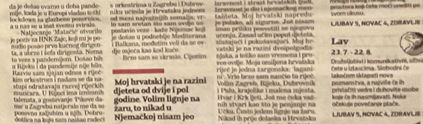
Muzičari kroz 4 generacije