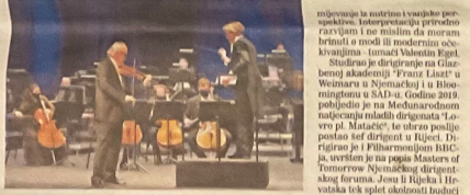
Muzičari kroz 4 generacije