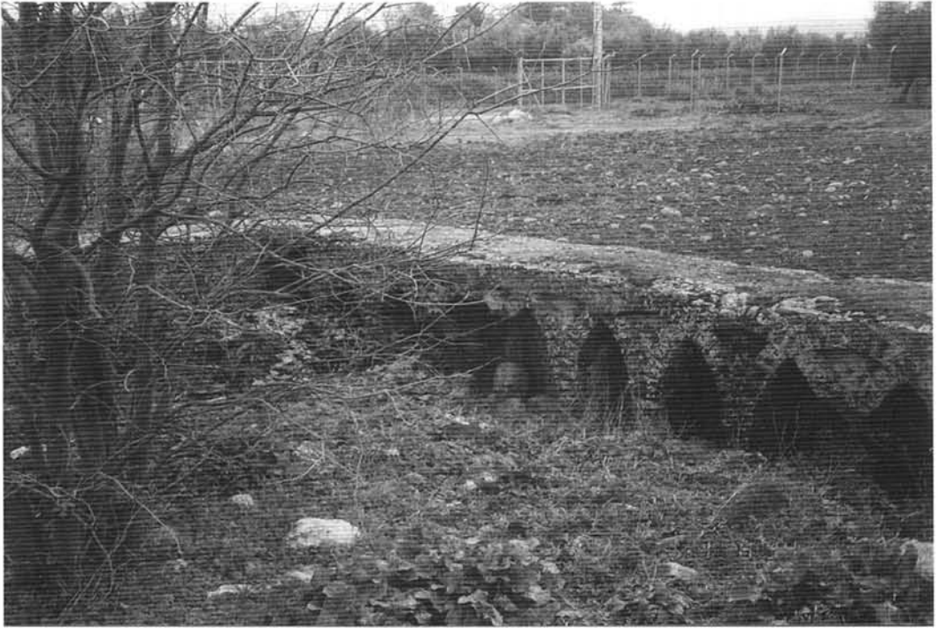
Restos de alberca árabe (Foto A. Arjona).