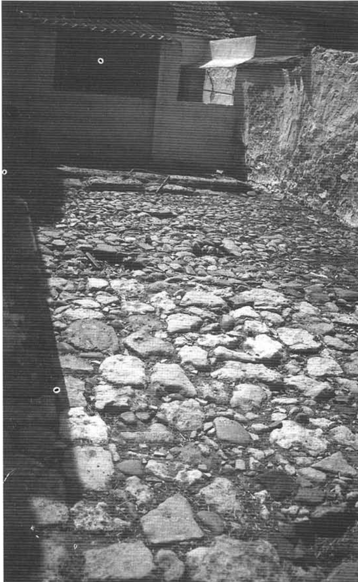
El arrecife construido por orden de 'Abd al-Rahman III entre Dar al-Na'ura y Madinat al-Zahrat.

Qarabita(Escarabita) 27 el año 29 (940-941) por la orilla inferior donde estaba la ciudad de Córdoba, para quitar al camino su dificultad. Cabalgó personalmente, mientras se hacían ante él las operaciones de agrimensura y se ponían los jalones de los límites, ordenando congregarse obreros y presurar la obra, que quedó concluida en un mes, con gran provecho de la nueva residencia llamada al-Zahra' y de todos". 28