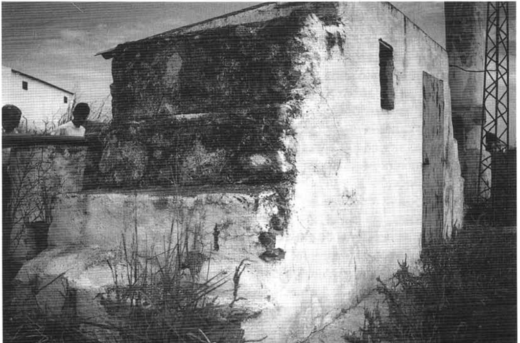
Caseta de la noria.