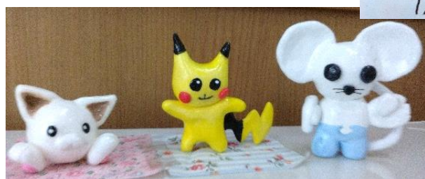
真ん中 ピカチュウの 原案です！